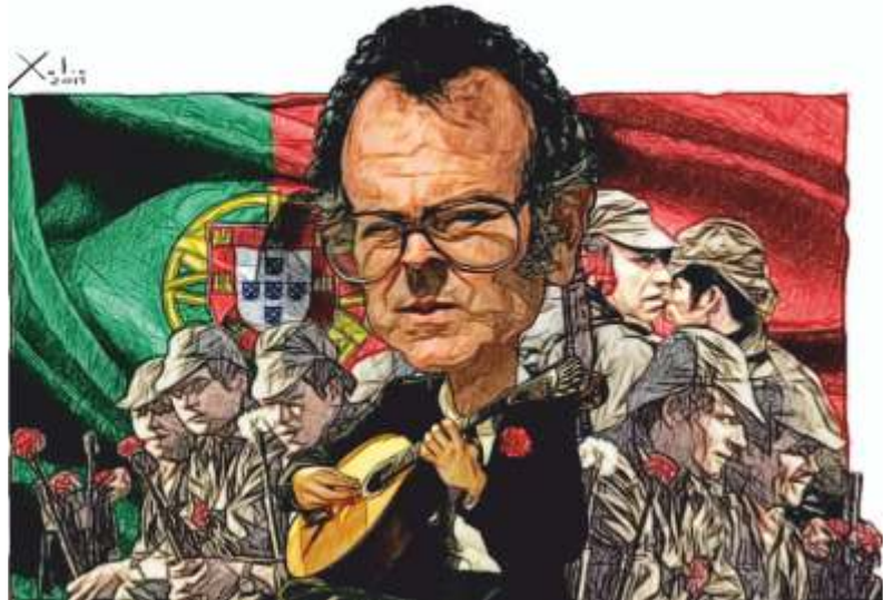
José Afonso “O Zeca” debuxado por Xulio Formoso

ham mais cinco!”, moi do gusto de Otelo Saraiva de Carvalho, sen dúbida o máis destacado ideólogo da Revolución.