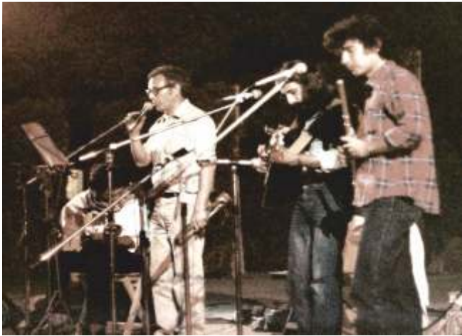
A última actuación do Zeca en Galicia foi o 8 de agosto de 1981 no Parque de Castrelos, acompañado de Janita Salomé, Júlio Pereira e Sérgio Mestre.