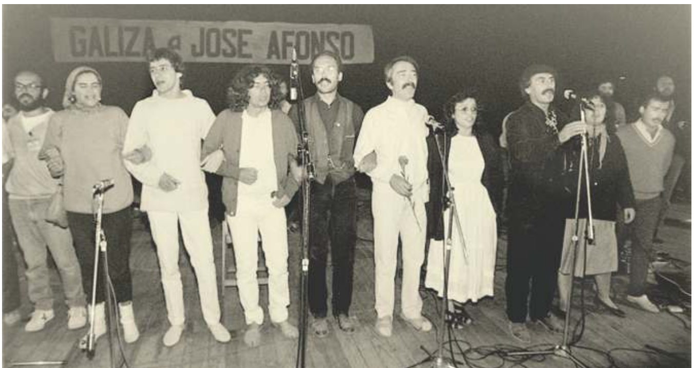
Algúns dos músicos que interviron no Festival Poético e Musical celebrado en Castrelos o 31 de agosto de 1985 en Homenaxe ao Zeca.