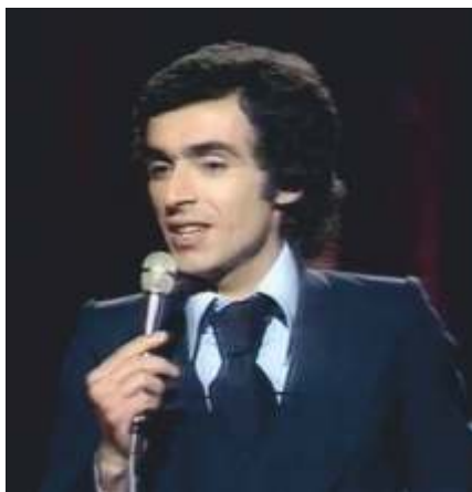
Paulo de Carvalho

Manuel Paulo de Carvalho Costa, o eurovisivo, coñecido artisticamente por Paulo de Carvalho, daquela viña ser un xeito de Julio Iglesias á portuguesa, coa diferenza de que a súa fama rara vez traspasara as fronteiras do seu país, agás neses festivais, porque non sómentes representara a Portugal no de Eurovisión de 1974, senón que, asemade, participou posteriormente no de 1977, malia que como membro dun conxunto musical chamado “Os Amigos”. E aínda estivo a piques de acudir en máis ocasións, xa que se presentara á preselección das edicións de 1971, 1973, 1975 y 1984, ficando en todas elas nos postos máis destacados da clasificación nacional portuguesa, pero sen obter a “medalla de ouro”.