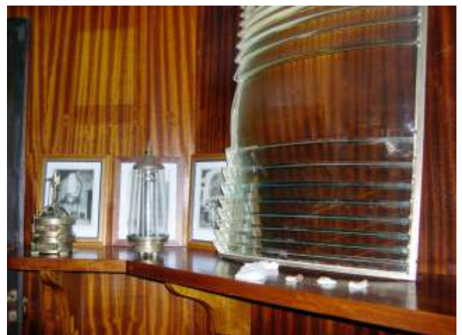
Algunhas das pezas que se exhibían no museo do Faro

Museo dos Faros: Ata o ano 2023, nunha das salas do Faro de Ons, había expostos un bo número de aparellos relacionados co propio Faro da Illa e doutros das proximidades.