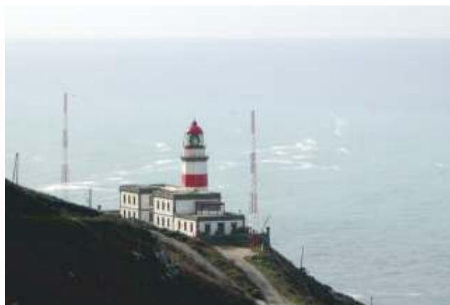
Faro de cabo Silleiro. Baiona. Un dos últimos en incorporarse a Faro hotel

que a figura do Fareiro xa non é necesaria e polo tanto esas instalacións, agás a lanterna e algún espazo necesario para a maquinaria, convértense para a administración nuns edificios que polas súas características e situación, van a representar un elevado custo económico de mantemento que non están dispostos a asumir.