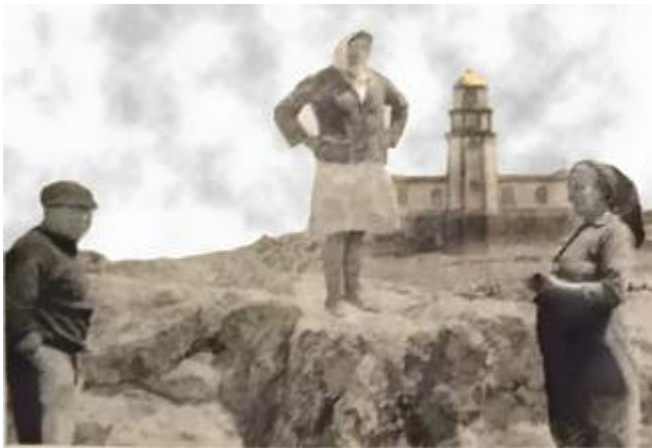
Veciños de Ons fronte ao faro en 1967