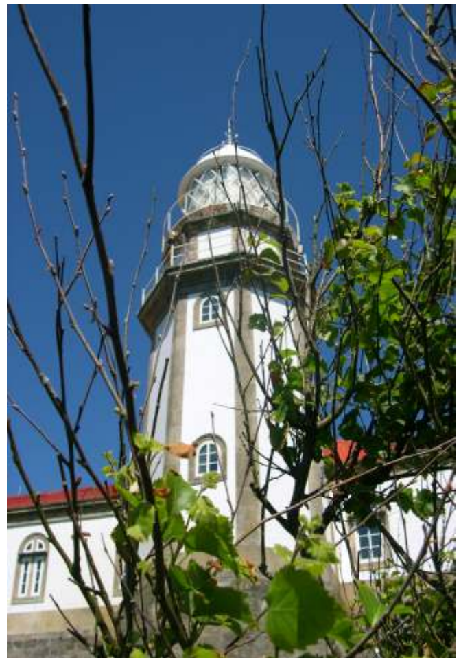
A torre do Faro ofrece vistas exclusivas sobre a Illa, a Ria e o mar

farían posible que tanto o Faro como o Centro de Visitantes sexan uns Espazos Activos que esperten fascinación por esta Illa, polas demais do Parque e pola cultural en xeral.