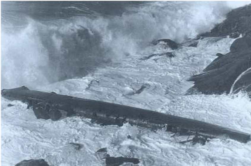
O submarino "General Mola" que encallou ao carón da Illa Freitosa, ao oeste de Ons.