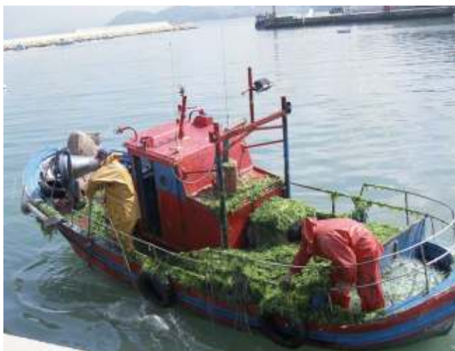
Barco con algas que viñeron nos aparellos.

Dende a antigüidade máis remota, os habitantes que vivían preto da costa utilizaban os recursos que o mar lles aportaba como fonte de alimentación. Dentro desta dieta que descubren os “cuncheiros” nos castros galegos, atópanse restos de espiñas, cunchas e exoesqueletos de moluscos e crustáceos e non así das partes brandas dos mesmos. Cabe pensar que na dieta entraban nalgún momento as algas, como ocorreu ao longo do tempo, sobre todo en períodos de escaseza ou fame. Como é lóxico, serían as que atopaban con facilidade na zona intermareal, como podían ser as Ulvas como a leituga de mar e outras pardas como as Laminarias, Fucus etc. Este consumo extra aportáballes unha serie de nutrientes vitamínicos, sales minerais e ata algunhas un aporte proteínico.