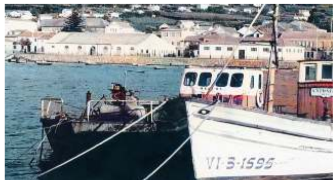
O “Merche” cos compresores na proa

Neste momento, Emilio Blanco deixou de empregar o baixo da súa casa como almacén e pasou a utilizar o baixo do encascador de redes da familia Bolívar, na actual Montero Ríos, que Ignacio Alzueta tiña alugado. Neste ano, Alzueta trae unha embarcación tipo gabarra: o “Merche”. Esta contaba con catro grandes tanques ou depósitos con fondo de arames, como se fose un grande coador ou reixa para reter as algas alí bombeadas. Polo bordo superior destes había uns raís onde ían montados os dous desaugadoiros das chuponas. Para a propulsión do barco tiña dous motores que tamén se utilizaban para as faenas de recolleita das algas, acoplándose ás dúas chuponas, o que provocaba non poucos problemas mecánicos de aquecemento do cambio de marchas que eran solucionados polo industrial mariñense afincado en Bueu, Luís Arias Pazos 6 , encargado do mantemento.