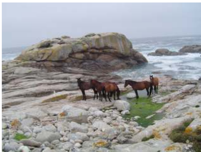
Cabalos en Sálvora 2005

Ao longo de todas as costas, en zonas accesibles, sen cantís, sobre todo nas illas ou na nosa contorna podíamos ver este mesmo aproveitamento das algas en poboacións de animais en estado salvaxe que de cando en vez acércanse ás pozas da beiramar para aproveitarse dos nutrientes e sales das algas.