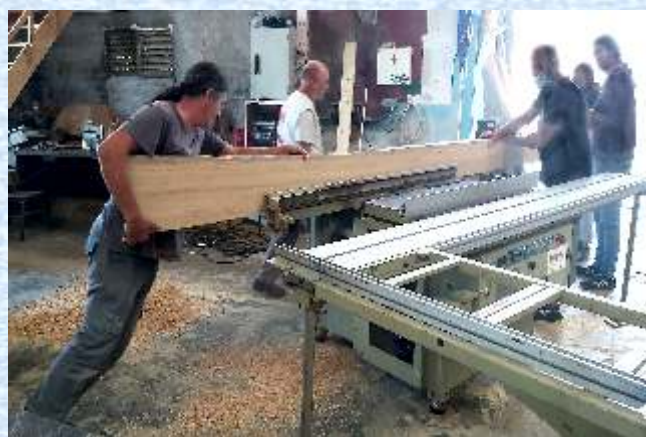
Traballos de preparación da madeira na nave de Pescadoira

Con ito, xa adoita tamén ser case unha tradición chapurrar inglés cos estranxeiros que acoden a Bueu co gallo do festival nestes días. Invitámosvos dende aquí, a que visitedes na rede o vídeo resumo que fixeron, onde nos dedican algúns segundos: https://youtube/bLrIIcDo2GzU