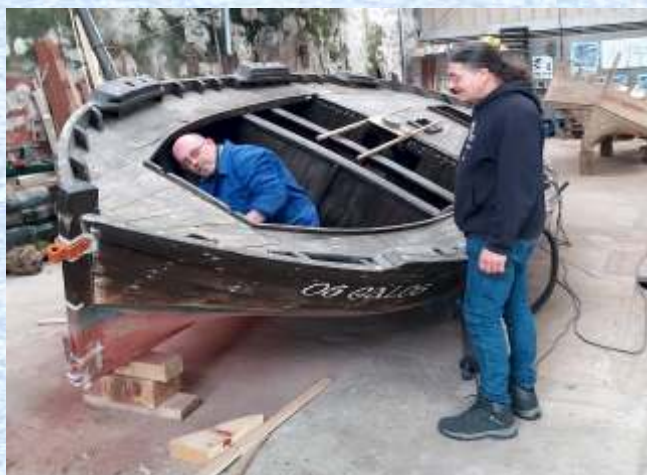
Reparación e mantemento dos barcos