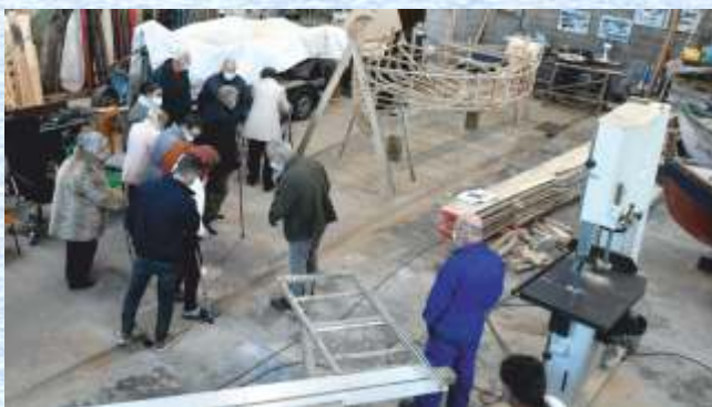
Visita do Centro de Día Contigo

Neste punto do discurso, queremos agradecer a todas e todos os que nos viñestes visitar ao longo do ano ao noso pequeno refuxio, e aproveitar para convidarvos a volver. Para nós, colaborar e axudarse entre diferentes colectivos veciñais, como foi o ca-