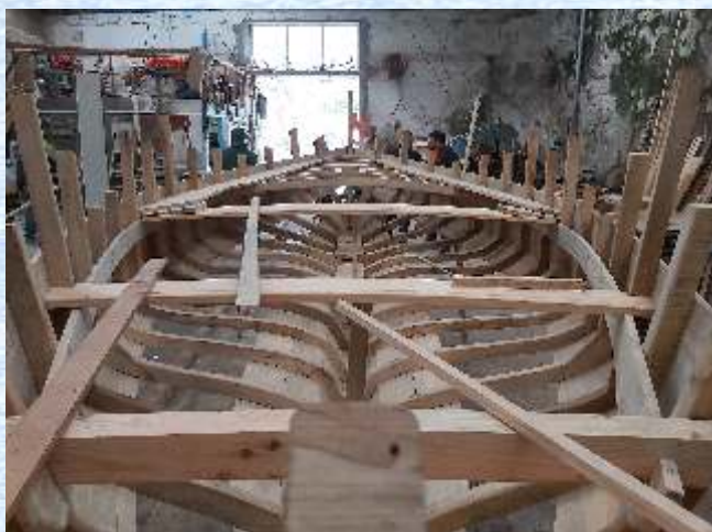
Cuadernas e parte do casco xa moi avanzados

Paseniñamente, os traballos foron avanzando, ata o punto de que á hora de escribir estas liñas comprácenos comunicar que temos pechado xa o casco da embarcación.