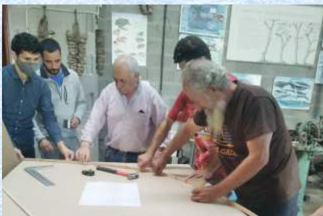
Planificando a construción da Mareira