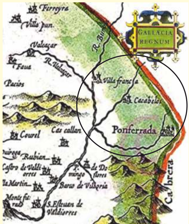
Mapa de Mercator. Galicia nestas datas co Bierzo