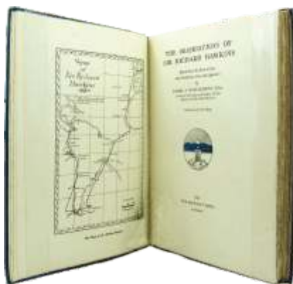
Libro de Richard Hawkins

Mais para contrarrestar esta visión cabaleiresca pero arriscada a ollos da Inquisición, introduce por veces alusións a Hawkins definíndoo como astuto ,