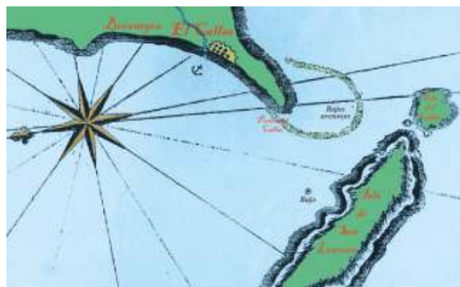
Bahía do Callao

Logo, remolcaron o barco cara a Illa das Pérolas e despois á Illa de Perico, porto da cidade de Panamá a onde chegaron o día 9 deste mes de xullo. A recepción nesta cidade foi xubilosa e os habitantes subiron a bordo do Dainty coa consideración dun bo trofeo de guerra xa que só as armas e municións tiñan un valor de 78.000 pesos. Durante varios meses o barco sufriu as reparacións necesarias para volver a navegar sendo que o virrei Hurtado de Mendoza non recibiu a noticia ata a madrugada do 14 de setembro e a pesar do intempestivo da hora, ordenou o repenique das campás da cidade e a celebración dunha misa solemne de acción de grazas na igrexa de San Agustín.