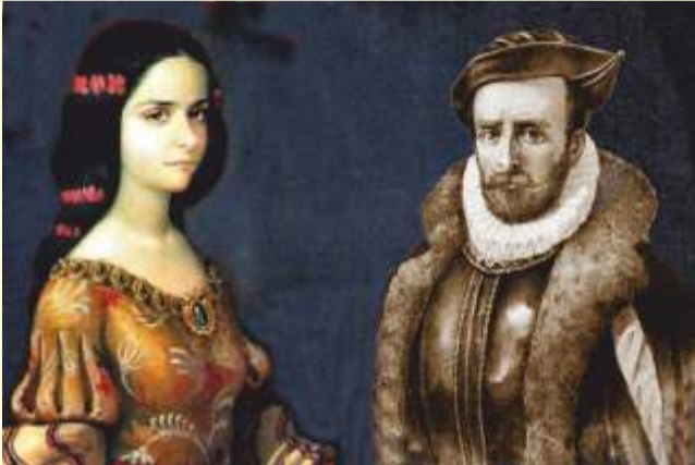
Isabel Barreto e Álvaro de Mendaña

Como vimos, a expedición de Isabel Barreto e Álvaro de Mendaña ás Illas Salomón entrecrúzase nos nosos relatos e a través dos nosos artigos tentamos recuperar e reverter a óptica histórica coa que, a historiografía española antiga e a moderna adoita obviar ou incluso menosvalorar con frecuencia aos galegos.