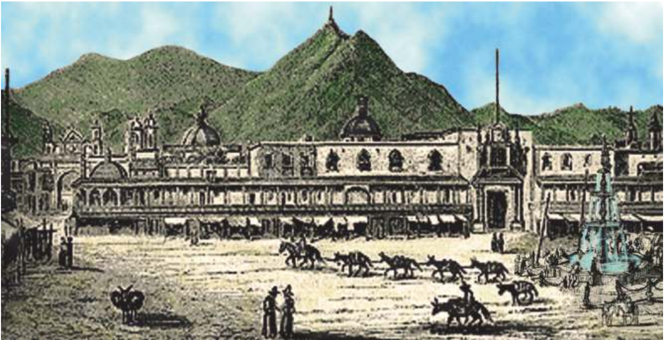
Praza maior de Lima nesta época