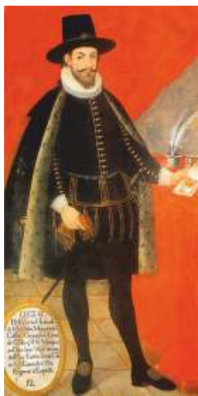
O virrei Hurtado de Mendoza