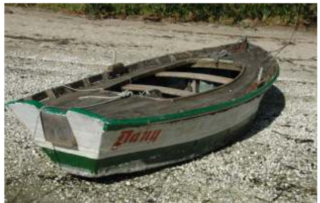
Chalana tipo “loro” en Cortegada

Xa nos anos 70 coa auxe dos cultivos de marisco, fíxose necesario transportar maior volume de bivalvos e varar a embarcación na area moi a miúdo. Como consecuencia disto prodúcese un cambio radical no tipo de embarcación empregada e aparecen unhas chalanas (1) moi peculiares chamadas “loros”, máis anchas e de fondo plano, con proa pechada e popa aberta e moi pouco puntal (altura).