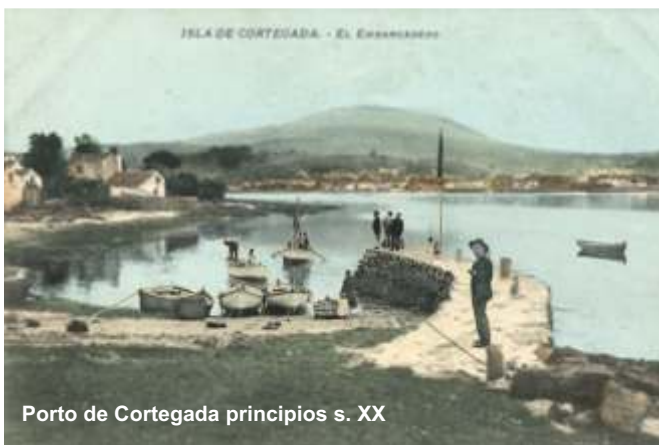
Porto de Cortegada principios s. XX

A principios do século pasado, como consecuencia da auxe da arte do bou de vara, fíxose necesaria unha embarcación máis robusta e con máis vela que “tirase” deste arrastre polo fondo. Así xorde o bote de Carril, embarcación máis pechada e forte que aparelha vela latina e que se vai facer moi popular na zona.