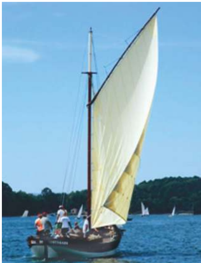
Galeón Illa de Cortegada

Hai que ter en conta que Carril, ao ser unha zona interior da ría moi abrigada e o estar moi próximo a Santiago de Compostela, foi un dos portos máis importantes da historia de Galicia e incluso foi concello propio ata principios do século XIX. Por isto, a presenza de galeóns (tipo galego), que eran os barcos máis empregados para o transporte de todo tipo de mercadorías, era moi masiva naquela época, polo que o galeón tamén é unha embarcación moi vencellada culturalmente a Carril.