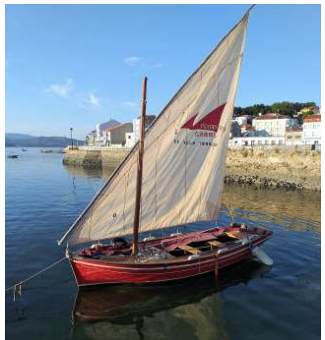
Bote de Carril coa súa vela latina

En Carril, ao ser unha zona interior da ría e polo tanto máis protexida, empregábanse sobre todo embarcacións que permitisen aparelhar velas máis amplas como a vela latina ou a mística, coa fin de aproveitar mellor os ventos máis suaves da enseada. Tamén era importante que puidesen vararse na area dado o tipo de fondos que hai nesa zona. Así, a principios do S. XX, predominaban sobre todo as bucetas, chalanas, galeóns e o propio bote de Carril.