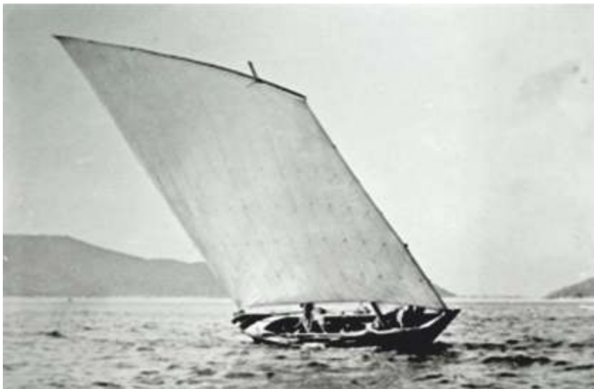
O Chuco coa súa gamela nas Cíes. Anos 60.