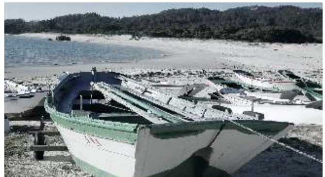
Gamelas coruxeiras na praia de Nerga (Cangas)

A súa desvantaxe quizais é que non navega demasiado ben “contra” o vento (cinguir ou bolinar). Pero no caso de Cíes, posiblemente a maior altura dos montes do Morrazo e a das propias illas, así como a súa maior proximidade a terra (2.5 km ata Cabo Home) eran factores que diminuían a influencia dos ventos do norte, facendo que se puidera navegar no seu entorno sen necesidade de ter que aproar demasiado o vento.