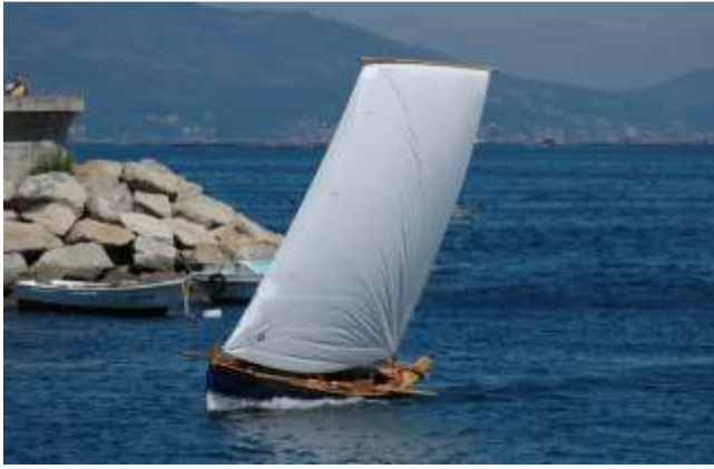
Dorna cinguindo ou bolinando

Aínda que pola súa afiada quilla a dorna non é unha embarcación axeitada para varar na praia, a súa lixeireza permite subilas pola mesma con bastante facilidade, para o que bastan tres ou catro persoas.