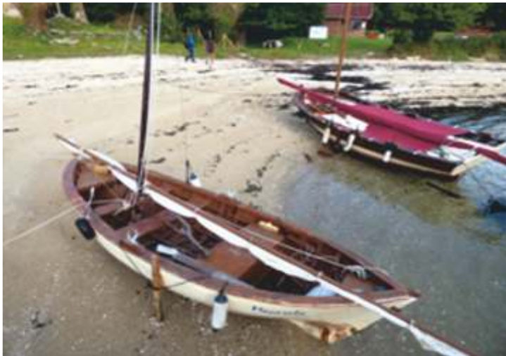
Buceta (esquerda) e bote de Carril (dereita) en Cortegada

Hai que ter en conta que Carril, ao ser unha zona interior da ría moi abrigada e o estar moi próximo a Santiago de Compostela, foi un dos portos máis importantes da historia de Galicia e incluso foi concello propio ata principios do século XIX. Por isto, a presenza de galeóns (tipo galego), que eran os barcos máis empregados para o transporte de todo tipo de mercadorías, era moi masiva naquela época, polo que o galeón tamén é unha embarcación moi vencellada culturalmente a Carril.