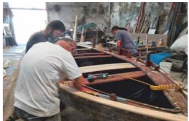
A dorna Elvira durante a súa restauración

O autor relaciona ademais a dorna co drakkar viquingo xa que ambas embarcacións teñen moitas similitudes estruturais. As táboas da armazón van montadas unhas sobre outras (en calime ou tingladio ) e a súa afiada quilla prolóngase ata o característico pico de proa. Mörling considera a dorna unha embarcación de orixe nórdico, e a súa presenza en Galicia só podería responder á influencia das devastadoras razzias ou incursións viquingas que asolaron as nosas costas entre os séculos IX e XII.