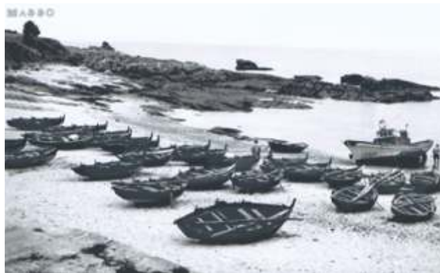
Dornas na praia do Curro. 1966.

A vinculación da dorna co arquipélago de Ons está máis que documentada en numerosos artigos, publicacións e arquivos fotográficos. Calcúlase que nos anos 60 había máis dun cento de dornas nesta illa, mínimo unha dorna por cada casa e había 78 casas das cales algunhas tiñan dúas ou tres. As de Ons son dornas pequenas e lixeiras, de tipo polbeiro e precisamente adicábanse sobre todo a pesca deste cefalópodo mediante o uso da raña.