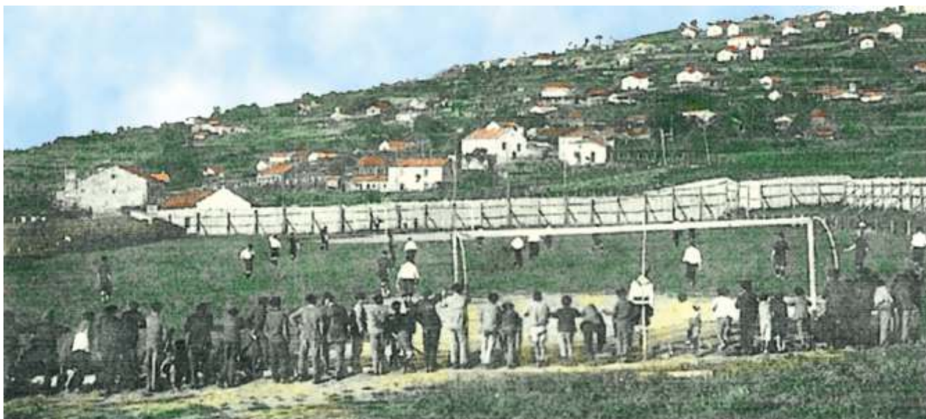
Partido en Corredoiras 1928

Acabada a guerra civil, na década dos anos corenta, o fútbol coñeceu en Bueu unha etapa de esplendor. Os partidos seguiron a celebrarse no campo da Feira e neses anos aínda había dous equipos de fútbol de antes da guerra, o Rápido e o Dique, que competían entre eles a falla dunha liga oficial á que adscribirse. A indumentaria era camisola azul (herdada dos falanxistas) e pantalón branco.