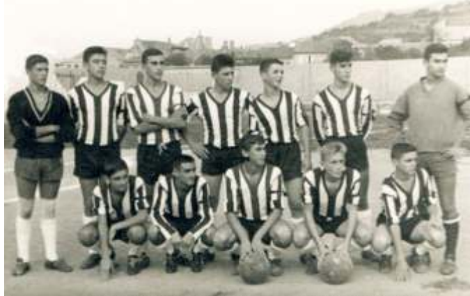
Diferentes formacións do Bueu xuvenís