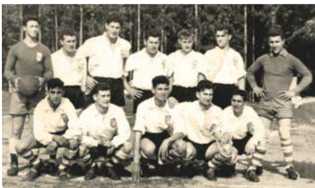
Unha formación do Bueu C. F.