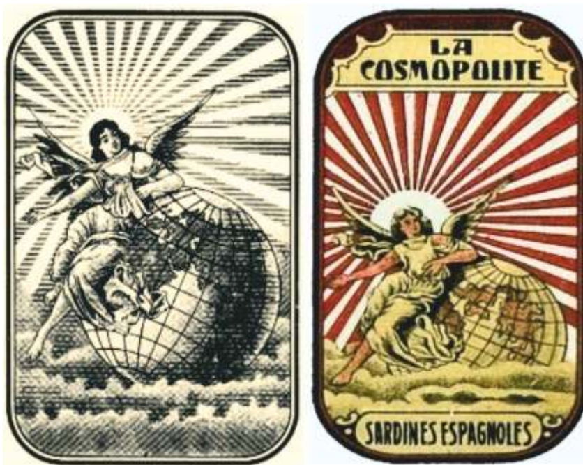
Marca rexistrada en 1899 e lata despois da denuncia de Curbera a Massó Hermanos

E fai esta manifestación, como única á que se cre obrigado en canto a ese primeiro extremo da conciliación; pois en orde aos dereitos do demandante, derivados da sentenza, serán os que a Lei lle outorgue, independentemente do recoñecemento que se pide ao demandado. En canto ao segundo extremo da conciliación, non pode avirse a indemnizar prexuízo algún, porque non os hai, e porque o demandante carece ademais de dereito para reclamar esa indemnización. ”