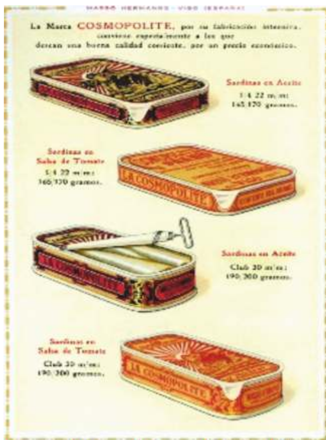
Catálogo Conservas Massó 1924