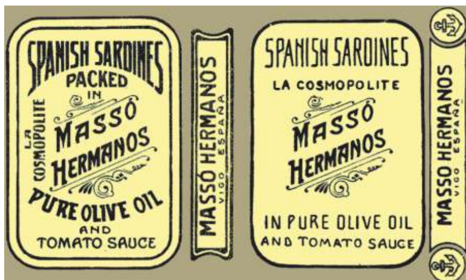
La Cosmopolite. Archivo Histórico. Oficina de Patentes e Marcas