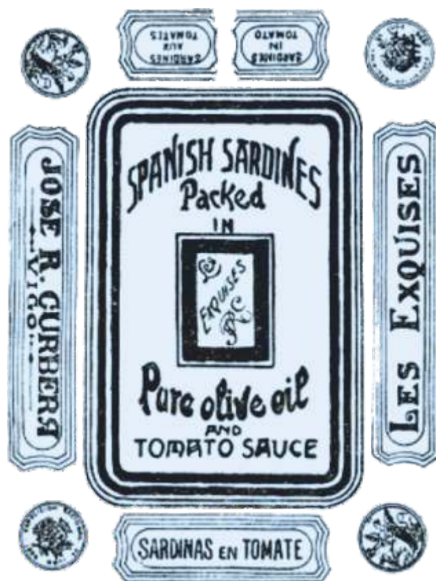
Spanish Sardines Nº 16845 J. R. Curbera. Archivo Histórico. Oficina de Patentes e Marcas

quises ” para distinguir sardiñas e peixe en conser-va, cuxa marca consiste nun gráfico, coas letras J. R. C. pechadas nun rectángulo de marco ancho, se-guido duns filetes. Exteriormente lese “ Spanish sar-dines - Packed in pure olive oil and tomato sauce ”. A etiqueta é rectangular, correspondendo á cara su-perior da lata de sardiñas e exteriormente hai outros