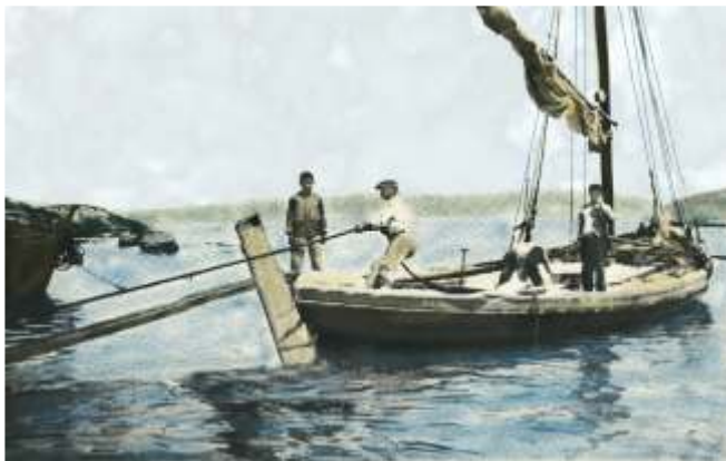
Descargando sal dun galeón en Galicia