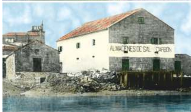
Alfolís de Pontecesures e Pontevedra