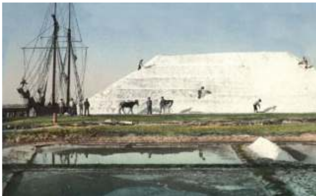
Salinas de San Fernando, Cádiz

pandeiretas, con destino aos portos do Levante, e todo presaxiaba que o negocio iría en aumento nos próximos tempos..., pero chegaba o momento de facerse escoitar ante o Goberno civil de Pontevedra, e se fose posible, ante a mesma Corte en Madrid, debido ao que consideraban unha inxustiza relacionada coas cotas do sal, imprescindible para os seus negocios.