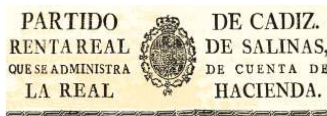
Documento no A.H.P. Pontevedra

Este requerimento xa viña de lonxe e así o 2 de agosto de 1855 van dirixirse en termos similares, aos responsables de Facenda, certificándolles que, “a fin de que se les pueda compeler el pago de lo que lleguen a adeudar otorgan al intento la obligación más eficaz, especial y general que al efecto se requiera para lo cual sujetar sus bienes y a mayor abundamiento concedores todos de los perjuicios que podía seguirseles de afianzarse los unos en los otros convienen en ello y en que si por cualquiera evento diese alguno en quiebra llegando a no tener con que pagar pueda el Sr. Administrador dirigir la ejecución contra cualquiera o contra todos los otorgantes sin que les sufrague la menor excusa...” .