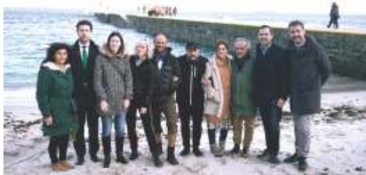
Plantel de actrices e actores en Ons

pola actriz belga Anaël Snoek. A rodaxe, realizada nos meses de outubro e novembro de 2019 pola produtora Maruxiña Films, non estivo exenta de dificultades polo mal tempo reinante e contou coa colaboración de cámaras en drones de Aeromedía que nos ofrecen espectaculares imaxes da illa.