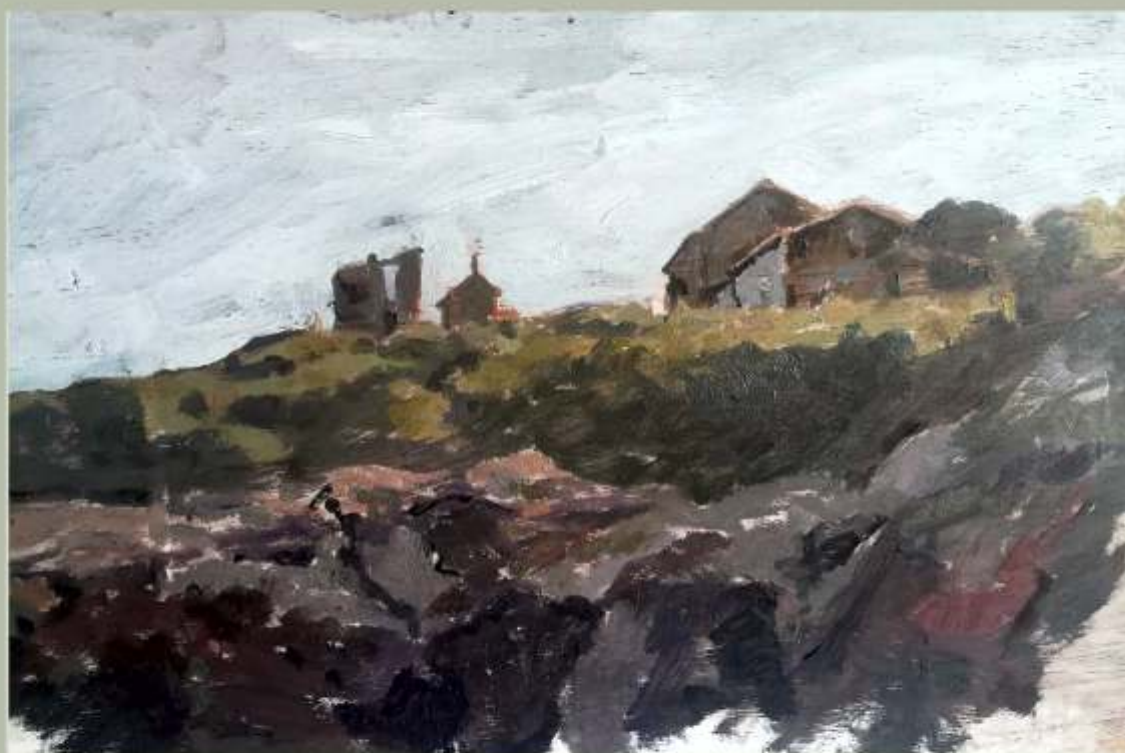
Hórreos de Canexol

Naqueles tempos ir á ILLA era facer unha viaxe no tempo : os que quedaron nela eran os derradeiros depositarios dunha cultura en desaparición , e os que marcharon , case todos , deixaron os hórreos valeiros coma metáforas do abandono.