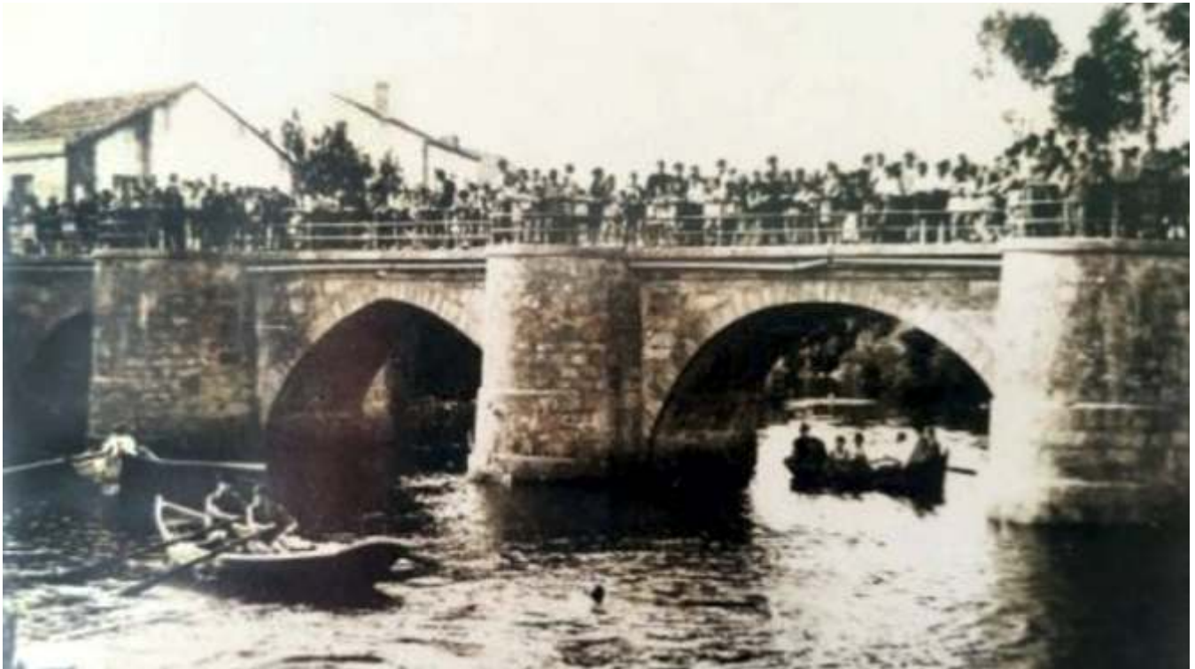
A Ponte do Porto nunha imaxe retrospectiva