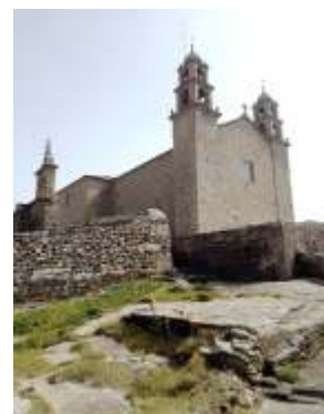
A Virxe da Barca

No porto da vila hai unha pequena flota de baixura, pero apenas distingo un par de embarcacións de madeira; substituídas por planadoras de fibra sen a mínima forma mariñeira. No porto deportivo, numerosas embarcacións de 7ª lista agar-