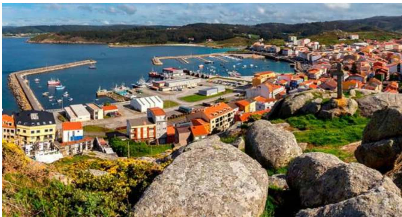
Panorámica de Muxía

Neste artigo, o autor rememora unha viaxe que fixo hai vinte anos, partindo cos seus acompañantes desde o Morrazo cara a Comarca de Fisterra , na Costa da Morte. No percorrido por esta zona, o viaxeiro, que non turista, destaca os valores culturais e monumentais máis salientables, sempre desde a óptica do mundo do mar que condiciona estes lugares en todos os seus aspectos.