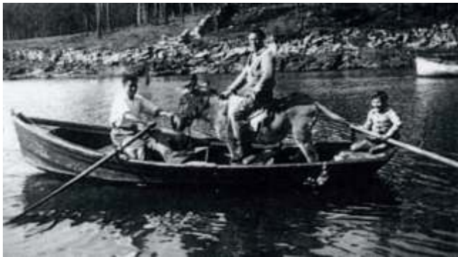
Antano, a pasaxe en barca aforraba o rodeo pola ponte