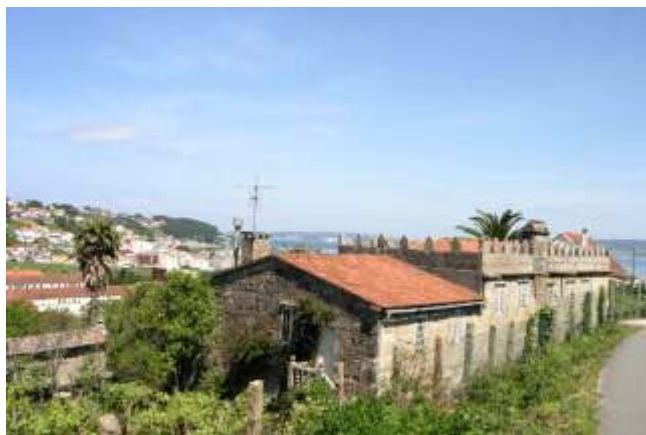
Pazo do Casal ou “Casa dos Picos”