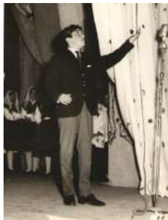
Festival no cine Avenica c. 1963