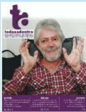
A derradeira entrevista

En “Nada será mientras no vengas”, a identificación entre a letra e a melodía musical alcanza outra vez unha harmonía perfecta. Cúmrese así o anxeio de Farruco Sesto manifestado nos versos de “Camarada, camarita”, outra das cancións do CD: “La música se ha encontrado con el sabor del poema”.