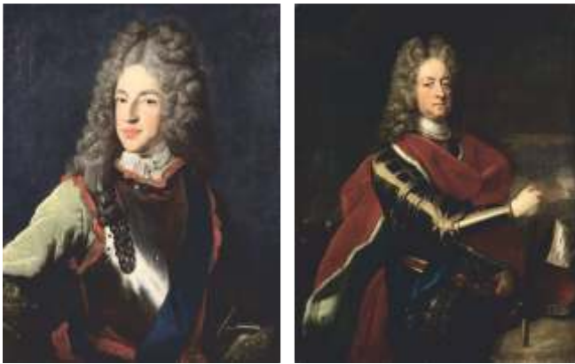
James Francis Edward Stuart James Butler duque de Ormond

rante ao trono inglés, Xacobo III Stuardo e máis James Buttler, duque de Ormond que agardaba en Sada para comandar a flota e a invasión.