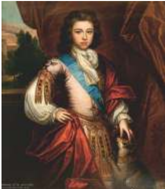
W. MacKenzie conde de Seaforth