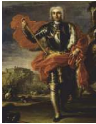
George William Keith Earl Marischal of Scotland