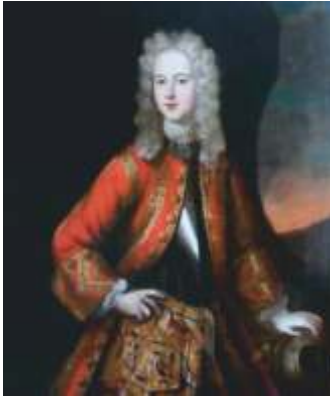
William Murray marques de Tullibardine