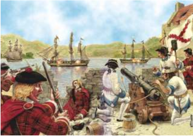
Recreación errada do ataque inglés a Eilean Donan pois os defensores non contaban con artillaría nin había tantos escoceses nel. Porén, os uniformes do Batallón Galicia son os correctos.

Antes disto, destruíron algunhas armas pero os ingleses aínda se apoderaron de 52 barriles de munición e 343 de pólvora que empregaron en destruír o castelo cuxos fortes muros resistiran os bombardeos ingleses a pesar de non contar con artillaría. No castelo renderonse un capitán, un tenente, un sargento e 39 soldados do batallón Galicia, que foron levados a unha prisión de Edimburgo na fragata Flamboroug , e máis un escocés e un irlandés que posiblemente serían fusilados por rebelión contra a Coroa inglesa.