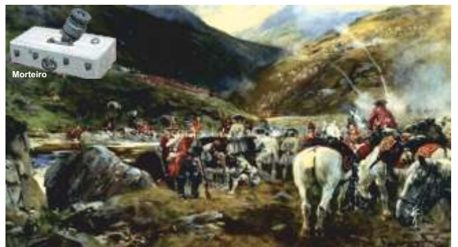
Detalle do ataque dos Dragóns cos morteiros Coehorn

Ás oito da tarde, despois do movemento envolvente das tropas inglesas, os españois comezan a retirada cara a unha altura rochosa na que se parapetaron, pero despois dunha hora de resistencia, sobre as nove da noite, Nicolás Bolaño decide renderse logo de catro horas de combate. Os galegos xa combatían sós, pois os escoceses foran desaparecendo aproveitando o luscofusco, conseguindo fuxir os seus líderes, algúns feridos e outros pasando ao continente para se salvaren da forza.