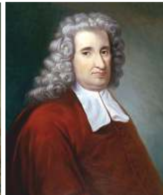
Cardeal Giulio Alberoni