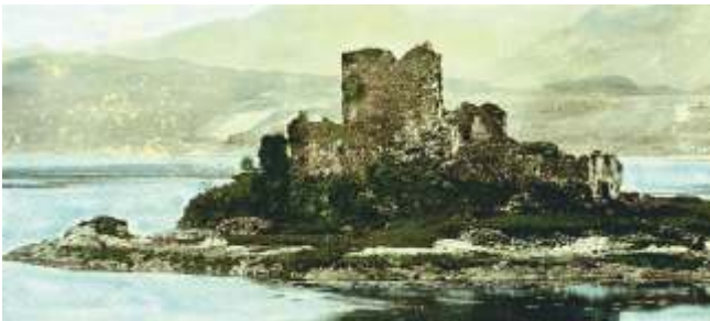
Ruínas de Eilean Donan antes da súa reconstrución

Antes disto, destruíron algunhas armas pero os ingleses aínda se apoderaron de 52 barriles de munición e 343 de pólvora que empregaron en destruír o castelo cuxos fortes muros resistiran os bombardeos ingleses a pesar de non contar con artillaría. No castelo renderonse un capitán, un tenente, un sargento e 39 soldados do batallón Galicia, que foron levados a unha prisión de Edimburgo na fragata Flamboroug , e máis un escocés e un irlandés que posiblemente serían fusilados por rebelión contra a Coroa inglesa.