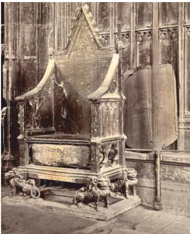
Cadeira de Westminster na que se proclaman o reis ingleses

A lenda da Pedra do Destino está interpolada, igual que moitas das lendas galegas, por relatos bíblicos pois esta, segundo se conta, non é nen máis nen menos que aquela que usara Xacob para repousar a sua cabeza cando lle aconteceu o episodio do sono. Dise que logo foi levada a Exipto durante o cautiverio dos israelitas e nun longo periplo de anos foi traída deica Brigantium en Galicia, reinando Breogán e que o seu fillo Ith foi quen a levou a Eirin onde lle chamaron Lia Fáil , a pedra que berra pois. Cóntase que quen a sacou de Exipto foi un grego (ou un escítio, ou un galo segundo as versións) que casara con Scota (Escocia), filla do Faraó.