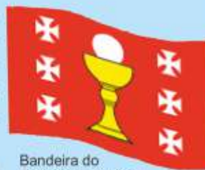
Bandeira do Reximento Galicia