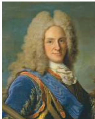
Rei Filipe V

A invasión constaba de varios movimientos de tropas que debían confluir nun momento dado: Polo leste, invadirían Gran Bretaña tropas rusas e suecas do rei Carlos XII pero a morte deste fixo que o herdeiro do trono se retirase da operación o que non foi óbice para que esta continuase só coa flota que se preparara en Vigo. Esta estaba ao mando de Baltasar Vélez Ladrón de Guevara que sae de Cádiz a principios de marzo con dous navíos de liña de 66 canóns, o buque insignia San Bartolomé (ou Cambi) e o Nª Señora de Guadalupe y San Antonio, ademais dunha fragata, a Hermione que saíra antes e recalara no porto do Ferrol para embarcar ao aspi-