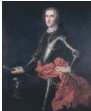
James Francis Edward Keith

Uns días máis tarde e desde o porto francés de Le Havre partiron nunha embarcación lixeira os líderes escoceses James Keith, irmán do anterior; William MacKenzie marqués de Seaforth e William Murray, marqués de Tullibardine que sería quen mandase as tropas escocesas.