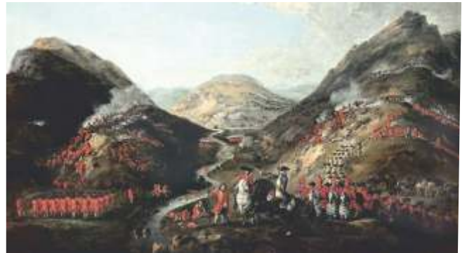
Batalla de Glen Shiel nun cadro de Peter Tillermans

gust, un exército de 850 soldados de infantaría cun reximento holandés, 150 dragóns, 236 escoceses leais ao rei inglés e 4 morteiros lixeiros Coehorn que habían ser definitorios na batalla pois o número de combatentes era similar, aínda que só os do batallón Galicia tiñan máis experiencia bélica. Xa que logo, fronte a eles, as forzas hispano-xacobitas contaban cuns 1.200 efectivos dos que uns 260 eran do batallón Galicia e uns 940 dos clans escoceses entre os que estaba o coñecido heroe literario Rob Roy.