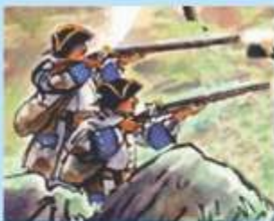
Soldados do Rxtº. Galicia