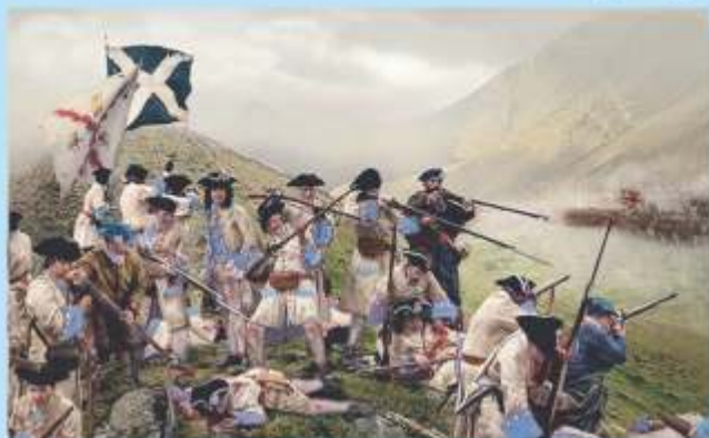
Recreación da Batalla de Glen Shiel