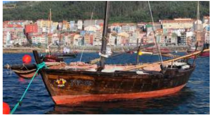
Unha das embarcacións dos Galos na Guarda

Desde estas páxinas queremos darlle os parabéns aos compañeiros de Piueiro polo éxito da cita, non só en canto á asistencia institucional, senón por conformar un atractivo programa de catro días con máis dunha ducia de exposicións, feira de artesanato, visitas guiadas, presentacións de publicacións, obradoiros, actuacións musicais... Cabe resaltar, asemade, a gran concorrencia de máis de oitenta embarcacións das nosas rías, tanto do norte como do sur e de lugares máis lonxanos como Lisboa, País Vasco Cataluña ou Irlanda que converteron o porto da Guarda non só nun espazo multicultural mariñeiro senón tamén de continuación do programa de Culturmar "O mar para tod@s".