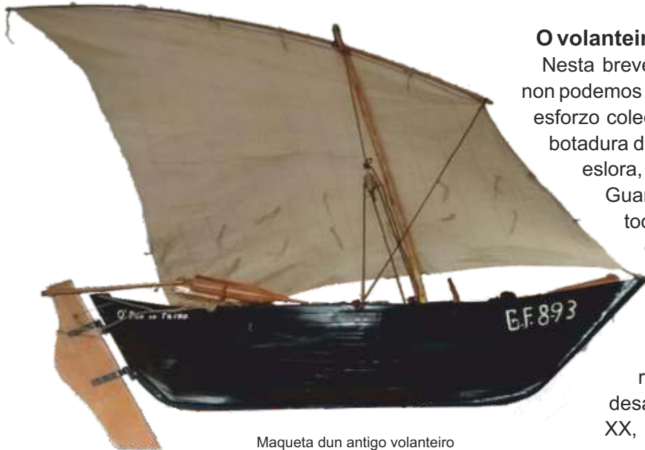
Maqueta dun antigo volanteiro

Este proxecto de inclusión que tivo en Muros os seus inicios, vén practicándose desde 2013 en todos os Encontros e nesta ocasión na Guarda, propiciou que unhas 80 persoas con discapacidade pudesen disfrutar do seu bautizo de mar.