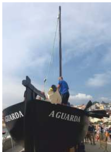
Construción, traslado e botadura do volanteiro