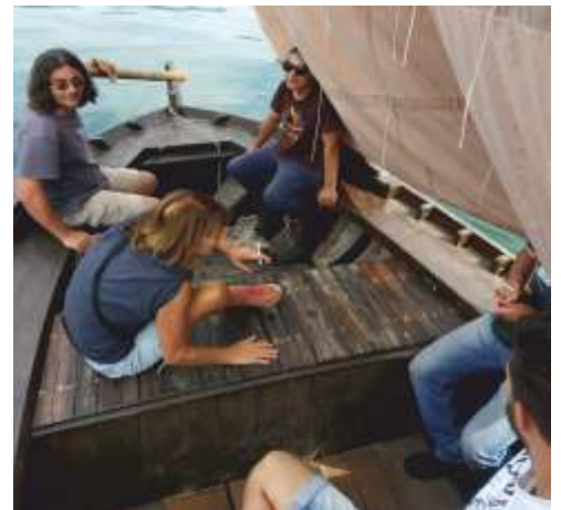
Tripulación de "Os Galos" na Guarda