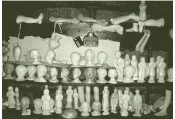
Exvotos de cera nun santuario de Galicia

recoñecemento pola graza recibida pois o incumprimento da promesa podía acarrexarlle graves consecuencias ao devoto. Neste sentido, a ausencia de exvotos nas igrexas do Morrazo téñen moito que ver coas advocacións das mesmas e non serén lugares históricos de peregrinaxe. aínda que se especula con certas ofrendas mortuorias no Hío sen documentar.