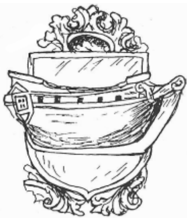
Lámpada e barco na Excolexiata de Cangas

Os primeiros testemuños votivos referentes ao mar xa aparecen nas cantigas de Santa María nas que se recollen promesas que logo serían recorrentes nos séculos posteriores como a de terse salvado de situacións perigosas nunha travesía ou a de encomendarse ao favor da Virxe, neste caso a de Rocamadour 1 , como fixo un rico-home portugués antes de emprender unha viaxe a Flandes xa que “muito amava Santa María e por ela fiava”: