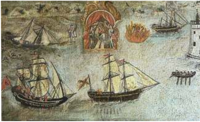
Ataque piratas turcos en Portugal 1758. Muros

boa, aínda que tamén hai augarelas en papel, eran tamén moi frecuentes, aínda que exixían o concurso dun pintor pagado para que reflectise o milagre, asunto que só podía asumir unha persoa adiñeirada. A maior parte deles ubícanse en igrexas da costa ou próximas pero nalgúns casos, quizáis por ser o mar un elemento extraño e considerado moi perigoso polos oferentes, son varias as igrexas do interior que tamén contan con exvotos mariñeiros como o barco existente no lonxano Santuario da Nosa Señora das Ermidas no concello do Bolo en Ourense.