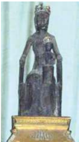
Virxe negra de Rocamadour

Porque amava muito Santa María de corazón, disse ca en romaria a Rocamador de bõa ment' irya tanto que o el podess' aver guisado con tal de que ella le protegese.