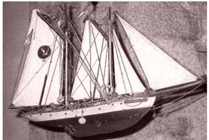
Exvoto na Virxe da Barca. Muxía

A narración do acontecido recolle que: Hallábase este Pedro de Centeno de Ayudante en la Plaza de Bayona, en el Reyno de Galicia, y su Gobernador le mandó salir en una chalupa el día 23 de septiembre del año de 1702 a reconocer una esquadra que se descubría, y halló eran Navíos de España.