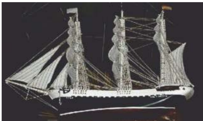
Bergantín "Vida y Dulzura. Porto do Son