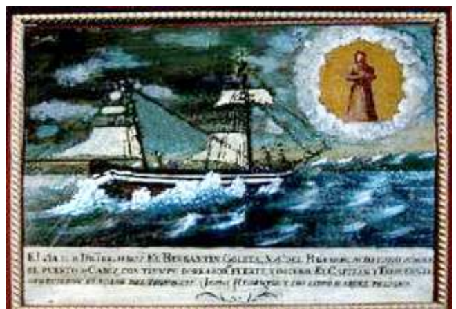
Bergantín-goleta N o Sra. del Rosario. Porto do Son

Encadramos nesta categoría aos exvotos de tipo tridimensional, a maioría en forma de maquetas de barcos, que aluden a un episodio perigoso ocorrido no mar e relacionado con naufraxios, tempestades, galernas, ataques piratas, conflitos bélicos... E tamén debemos referenciar os cadros pintados, quizais con maior interese por conteren a imaxe e o relato do acontecido, sendo algúns deles, dentro da súa inxenuidade, auténticas testemuñas dos milagres acontecidos, datos de historia mariña e pistas para os expertos sobre pintores de ámbito local. Estes exvotos bidimensionais, a maioría óleos sobre tá-