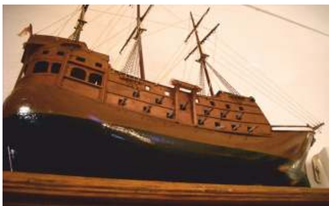
Exvoto dun mariñeiro basco na ermida da Guía

durou e que foi desfavorable á flota hispano-francesa. Tamén nesta ocasión, don Pedro había saír ileso da mesma e cabe que matínase en que quizáis seguía aínda baixo a protección da Virxe pois non volveu ofrecerlle outro barco ao santuario. Como fose, as crónicas desta batalla nada nos contan disto e se sabemos algo máis deste e doutros terribles episodios marítimos é grazas aos datos e imaxes que nos transmiten os exvotos que aínda perduran, pois moitos outros desapareceron como os crocodilos do Santuario da Nosa Señora de Monte Medo, que de seguro nos remitían a un perigoso episodio dun emigrante nalgún país de América. Porén, despois de máis de catrocentos anos, aínda perdura hoxe a reprodución do barco como ofrenda votiva á Virxe das Ermidas, santuario ao que sabemos que adoitaban acudir romeiros do Morrazo nos anos oitenta e noventa do pasado século.