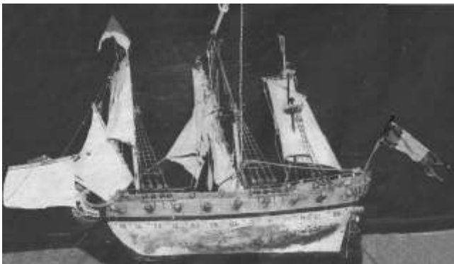
O navío exvoto no santuario das Ermidas

"Non é menos admirable o acontecemento seguinte que consta polo testemuño de D. Domingo González e declaración do tenente de cabalería D. Pedro de Centeno, natural de San Juan de la Cuesta de Sanabria e casado en San Salvador de Piñeiro (Lugo) con Graciana de Almonacid".