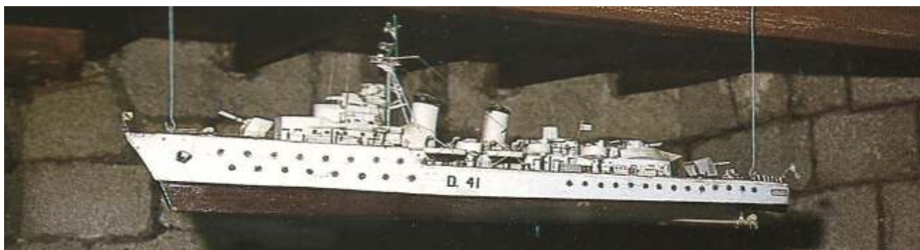
Acorazado "Oquendo". Santiago de Cuba 1898