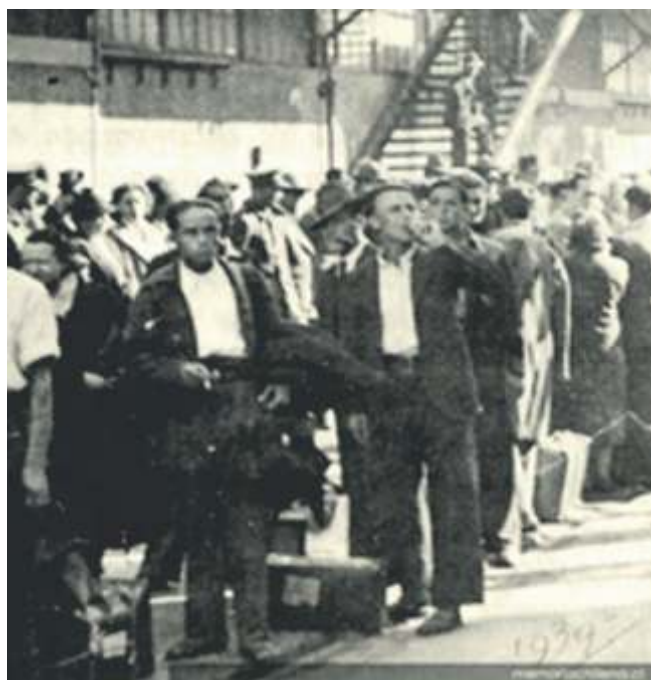
Exiliados españois en Chile