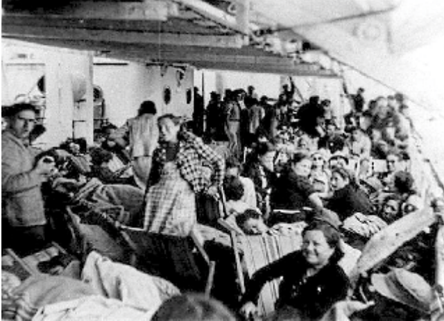
A bordo do Winnipeg