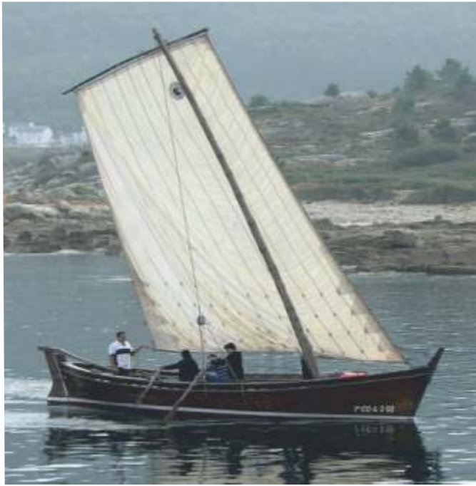
Lancha xeiteira restaurada

Las aves sirven de guía en el mar, indican donde va la comeduría y por lo tanto la pesca. Así se logra dar con el bonito, la sardina u otra especie.