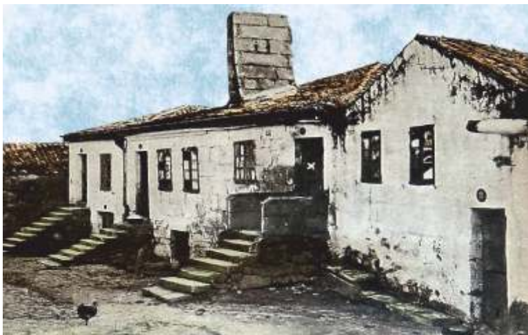
Un aspecto da Moureira

Desertor da Matrícula do Mar, a finais de 1823 e á idade de 18 anos, embarca cara á Habana onde se vai enrolar nun barco negreiro que navega entre as illas caribeñas. A súa vida entraría agora nun período do que non se teñen datos, ata que reaparece en Rio de Janeiro (Brasil) enrolado como 2º contramestre no bergantín O Defensor de Pedro , buque de 7 canóns e 40 homes de tripulación de bandeira brasileira, tamén negreiro e con patente de curso outorgada polo o goberno brasileiro.