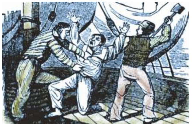
Gravado da época que reproduce un asalto de Soto

Parece ser que é despois da abordaxe do Morning Star cando Benito Soto decide cambiar o nome do seu bergantín, que pasa a nomearse A Burla Negra , facendo alusión á cor coa que foi repintado. Comeza así unha meteórica carreira de pillaxe. O buque seguinte en padecer a rapina de Soto foi o norteamericano Topaz procedente de Calcuta e con destino a Boston. Neste caso o botín foi de xoias, ouro e panos de seda. Tampouco deixaron testemuñas e volveron afundir o barco. Tocoulle despois, aínda que non está completamente confirmado, ao Unicorne , á altura das illas de Cabo Verde. Neste caso non se confirmaría o afundimento xa que parece que este buque conseguiu fuxir.