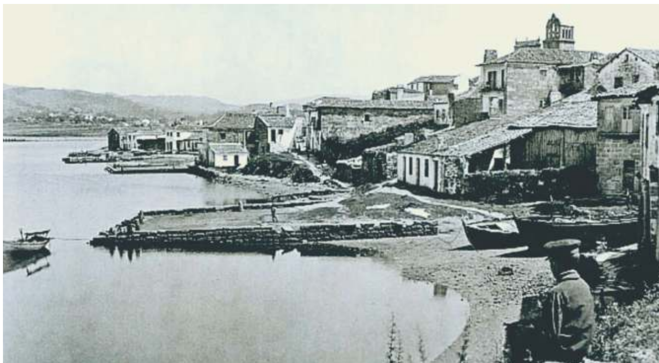
Peiraos e barrio mariñeiro da Moureira