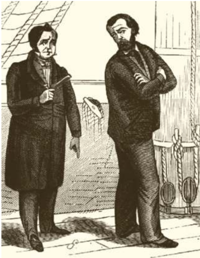
Outro gravado idealizando a figura de Soto

Tomando rumbo norte, e nas inmediacións do arquipélago canario, desvalixaron e afundiron a fragata inglesa Sunbury . Non volveron deixar testemuñas. Sempre co mesmo rumbo, abordaron nas inmediacións das illas dos Azores, ao buque inglés New Prospect e aos portugueses Cessnock e Hermerinda , e sempre co mesmo operativo: apropiarse do botín e non deixar testemuñas.