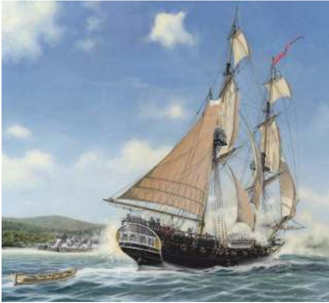
Un bergantín semellante ao de Soto