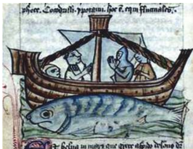
A balea Jasconio de San Brendan que os canarios cren que é a illa Inaccesible (aparece e desaparece) de San Borondón

Outro vello relato de tradición oral sobre baleas é o que publicou no Faro de Vigo, Antonio Carretero Mestre, tenente de navío retirado e que había ser reproducido noutras publicacións posteriormente. A narración semella que tivo un certo percorrido, igual que outras descritivas da pesca en Galicia e que foron remitidas desde un pobo de Cataluña onde foron achadas no arquivo dun falecido cónsul francés que desempeñou este cargo en Vigo.