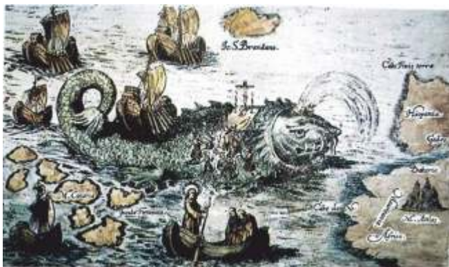
Misa de Pascua nunha balea. Crónica de 1621 do abade Caspar Plautius na primeira misión beneditina ao Novo Mundo

Mais, en Rianxo e durante un tempo, os mariñeiros seguían a discutir sobre se era de lei que os de Vilanova aproveitasen a balea sen darlle, ao menos, unha parte a eles. Cando un día aínda esbardallaban na taberna sobre o asunto, apareceu o mestre, home tido por moi espelido e de moita sabedoría, a quen lle demandaron opinión.