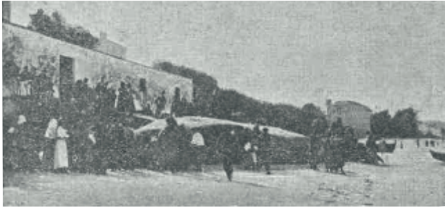
Curiosos observando a balea

Numeroso público volveu acudir naquel día á praia de San Gregorio, comentando algunhas delas o bo negocio que fixeran os mariñeiros, mentres algunhas outras lamentaban que non se adquerise o esquelete para o Instituto provincial de Pontevedra.