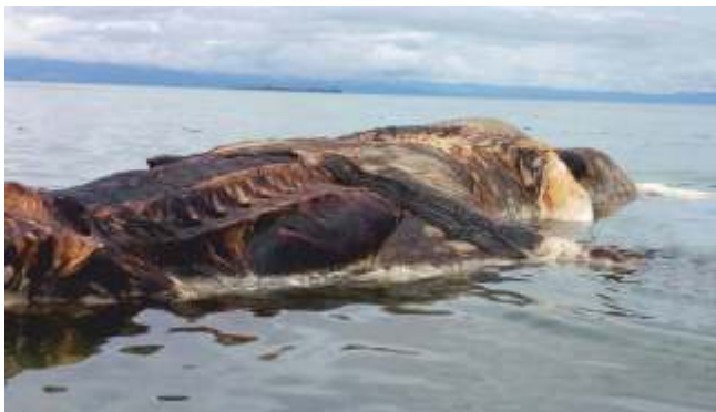
Balea en descomposición

Testemuña desta actividade baleeira xa fora o Licenciado Molina que a mediados do século XVI recollía: "Y luego Cayón, do bien se trabaja/ matar sus ballenas, que no es chica alhaja/ pues sacan aceite y en gran muchedumbre/ el cual no se come, mas para la lumbre, /se hace la oliva muy poca ventaja" .