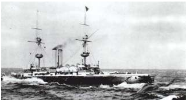
O Inmortality embestindo a balea

Outra reseña escrita provén do verán de 1891 e recolle que un acoirazado inglés, o "Inmortality", tropezou cunha balea de enorme tamaño ao saír da ría de Arousa: Foi tan violento o golpe que a tripulación pensou que petaran contra un con. O esporón do barco penetrou no corpo do cetáceo e, segundo a prensa da época, esnaquizou ao gran mamífero mariño. A noticia recollía textualmente: "Al dar contramáquina el "Inmortality", se desprendió de aquella masa casi partida en dos que se hundió en el mar, dejando las aguas enrojecidas en un espacio considerable" .