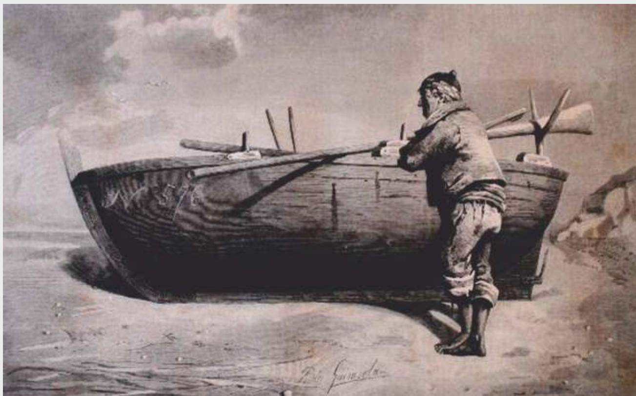
Gravado de Federico Guisasa de 1880 co título de Patrón co seu bote en Beluso