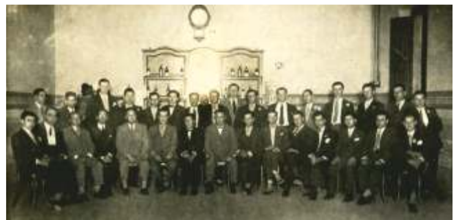
Banquete de despedida 11-10-1929