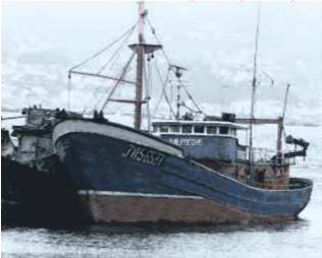
O Bernardo Alfageme ainda operativo

Neste tempo exercería de temoeiro na parella formada polos barcos Massó 18 e Bernardo Alfageme que faenaban no Gran Sol en plena II Guerra Europea onde foron metrallados por un avión tendo que refuxiarse na costa irlandesa. Con estes perigos, a alternativa da pesca para a flota galega estaría nos caladoiros do sur, tendo como bases de descarga Canarias ou Cádiz.