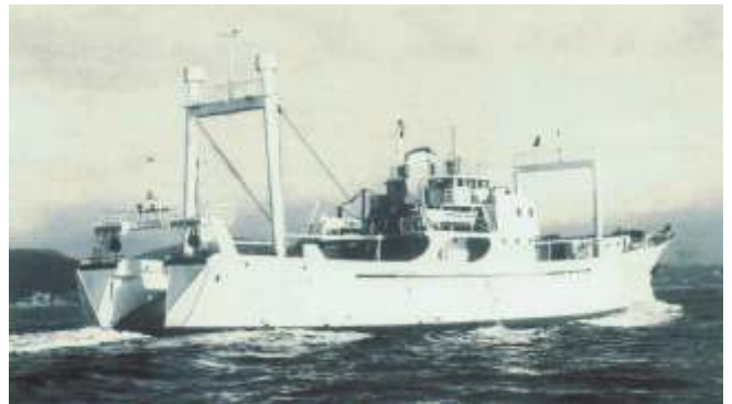
Barco da flota de Casa Mar

En 1963 alcanzaría o título de capitán de Pesca e en 1968 obtería o de capitán da Mariña Mercante, enrolándose en Pescanova como capitán de pesca no Espadarte á captura de pescada para conxelar en lugares máis cálidos da costa africana ata máis alá de Cidade do Cabo. Despois destas mareas máis tranquilas, decide retornar ao bacallau a Terranova e desde 1970, durante case vinte anos ata a súa xubilación, capitanearía barcos en parella da empresa PEBSA de Barrié de la Maza como a formada polo Esguío e o Arriscado ou o José Cornide e o Eduardo Chao .