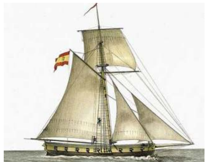
Tipo de barco utilizado no corso

¿Qué posición tomou Marcó del Pont diante da nova situación? Pois velaí no que reparou Pedro Feijóo Barreiro para, baseándose na documentación histórica manexada, desmentir os rumores e as acusacións de afrancesado que se verqueron sobre o empresario para soste taxativamente que, diante do invasor imperial, o catalán puxo, por enriba de todos os seus intereses económicos e comerciais, o seu patriotismo: “ A importancia de Buenaventura durante a Reconquista -refire Feijoo- baseouse en