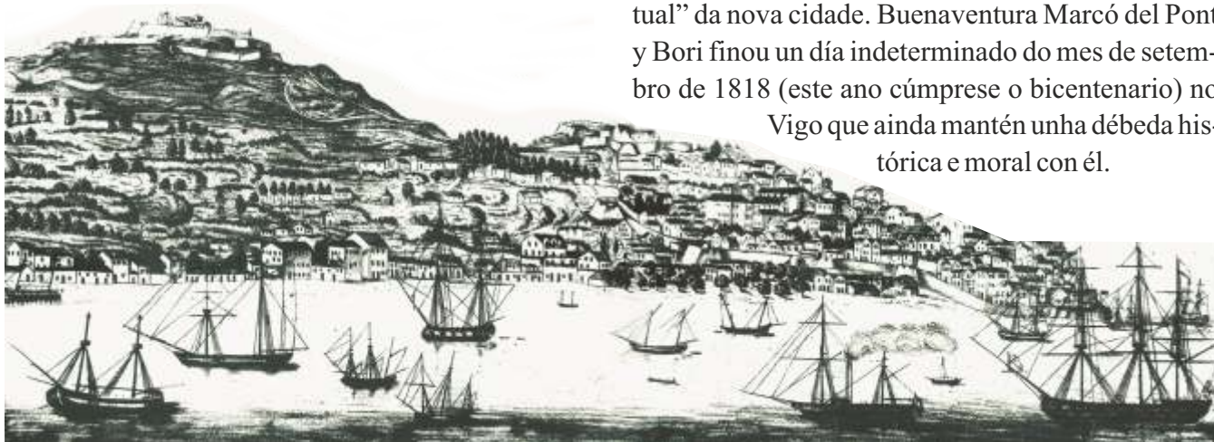
Vigo en 1840

Vigo que aínda mantén unha débeda histórica e moral con él.