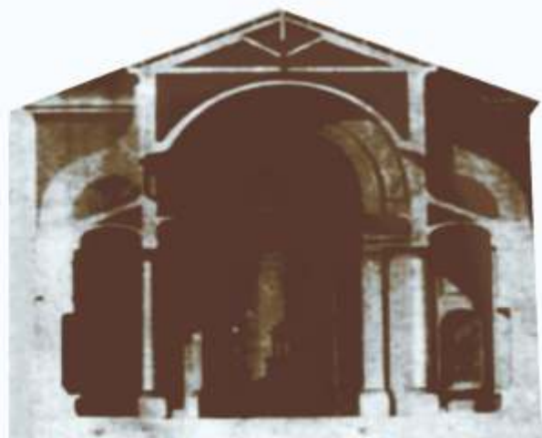
Debuxos do proxecto de construción da colexiata de Vigo