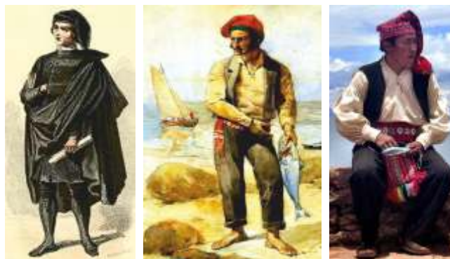
Barretas: Universitario e pescador do Ribatexo (Portugal) e Taquileño do lago Titicaca (Perú)

1 Sánchez Cidrás, Arturo: Jenaro Perez Villaamil debuxa Bueu. vila-debueu.blogspot.com.