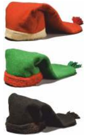
Barretas: poveira, do ribatejo e de uso común en Portugal

en Aveiro polo comercio do sal. A isto deberíamos engadirlle, aínda que de xeito especulativo, que a barreta tamén pudo ser levada a estes puntos do norte portugués por pescadores galegos ou mesmo por pescadores cataláns que nun comezo viñesen acompañando aos fomentadores cando a introdución da arte da xávega ( javec ) aquí nas nosas rías. De todos é coñecida a forte relación que desde antigo tiñan os nosos mariñeiros coas povoações costeiras portuguesas, sobretudo Aveiro de onde traían o peixe e tamén o sal que precisaban as fábricas de salga.