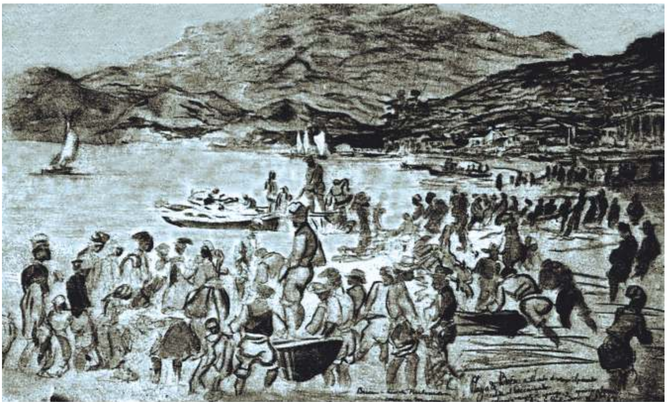
Playa de Bueu de Jenaro Pérez Villaamil. 1849