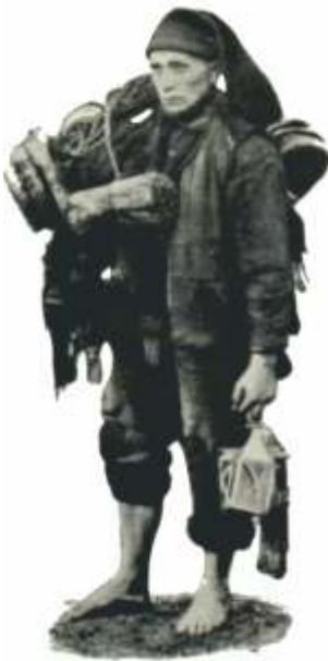
Tipo de pescador galego Fotogravado antigo

de salga en Aldán no ano 1764. A falta de máis referentes pictóricos neste sentido, lévanos cara a Póvoa de Varzim onde este pucho aínda forma parte hoxe do traxe típico poveiro e autores como o profesor e etnógrafo portuense Agostinho Araújo conseguiron datalo xa en 1773 através dun estudo sobre os exvotos nas igrexas da zona onde aparecen pintados mariñeiros con este tocado. O nome que lle dan a esta prenda é o de barreta (similar á barretina catalá) e tamén o de “catalão”, o que induce a pensar nunha mesma orixe que os que portan os mariñeiros da pintura de Bueu.