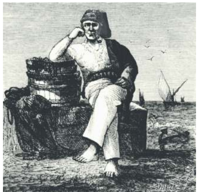
Gravado dun pescador poveiro

Da presenza temporal dos cataláns nesta zona aínda queda constancia hoxe o uso da arte xávega ou “varredeira” que desde aquí se expande ata as praias de Setúbal. Considerada hoxe en Portugal a xávega como a arte máis antiga, andan a facer campaña para a súa protección cando nós considerámola como unha arte esquilmativa. Inflúe nisto que, aínda que en desuso, agora fanse nas praias