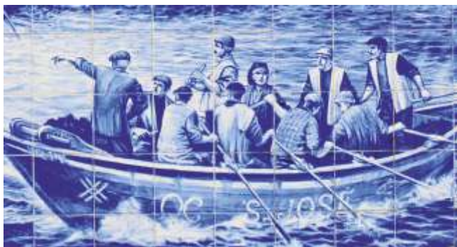
Unha barreta, un capiço e oito boinas

exhibicións turísticas (vimos unha na praia da Vagueira) con bois e homes e mulleres turrando da rede para o areal.