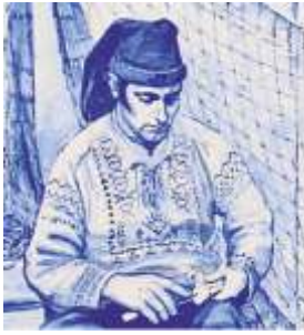
Barreta e camisola poveiras