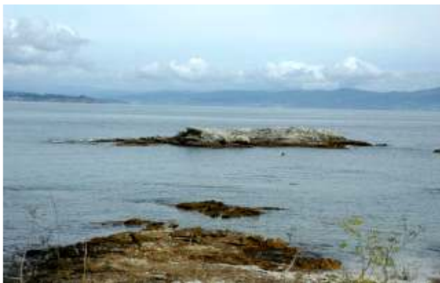
Illote "Laxe do Crego" visto dende o camiño que ven do barrio de Canexol cara a Curro.