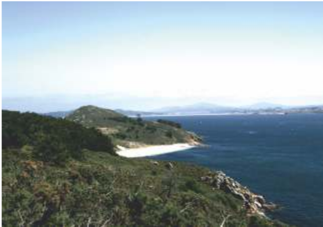
Praia de Melide. Enriba da praia unha das casas máis ao norte de Ons. Ao fondo o monte Centulo e á dereita a parroquia de Noalla (Sanxenxo)