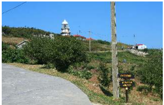
O Cucorno, barrio máis alto de Ons onde está ubicado o Faro