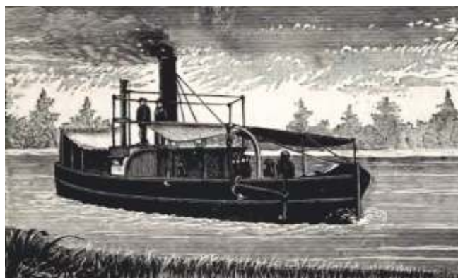
Vapor "El Sol Argentino"