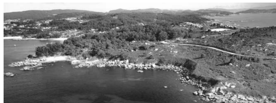
Carreiros de Udra