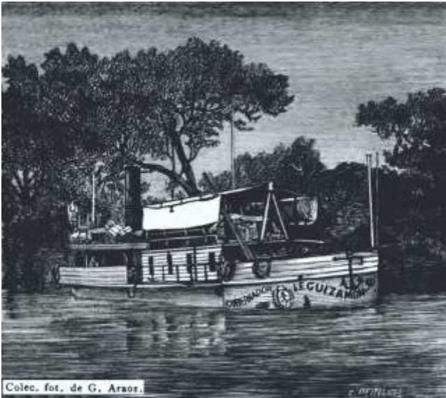
Vapor "Gobernador Leguizamon"