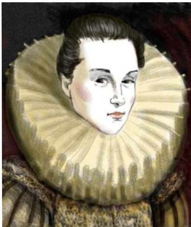
Retrato virtual de Isabel Barreto