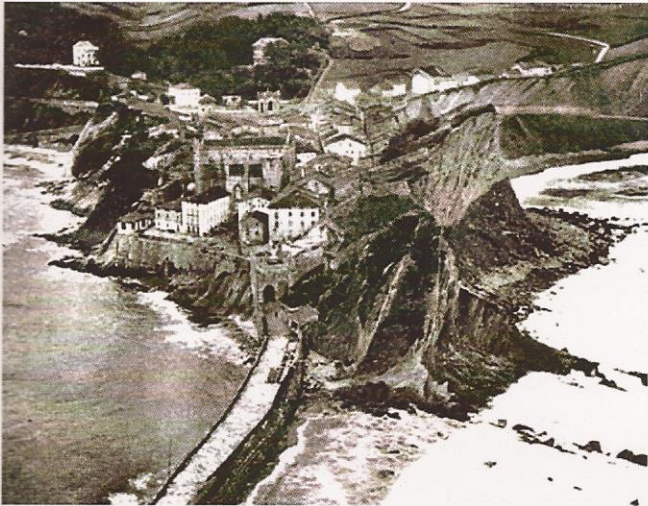
Vila de Guetaria

Apesar de crearse na Coruña unha especie de escola naval co nome de Seminario de Muchachos del Mar, a recluta das tripulacións tamén foi un despropósito ao contar con mariñeiros bisoños e facer as levas da infantería de mariña entre galegos pobres, a maioría labregos cansos e vellos, segundo as crónicas.