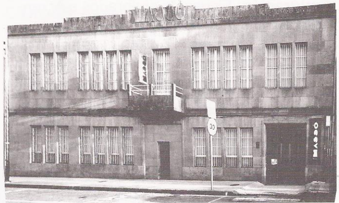
Edificio que alberga o Museo

Mais como todos sabemos, aquela idea frutificaría e hoxe, apesar de moitas dificultades e atrancos, conforma unha marabillosa realidade para Bueu: Poder contar cun Museo e Biblioteca marítimos, sen igual en Galicia.