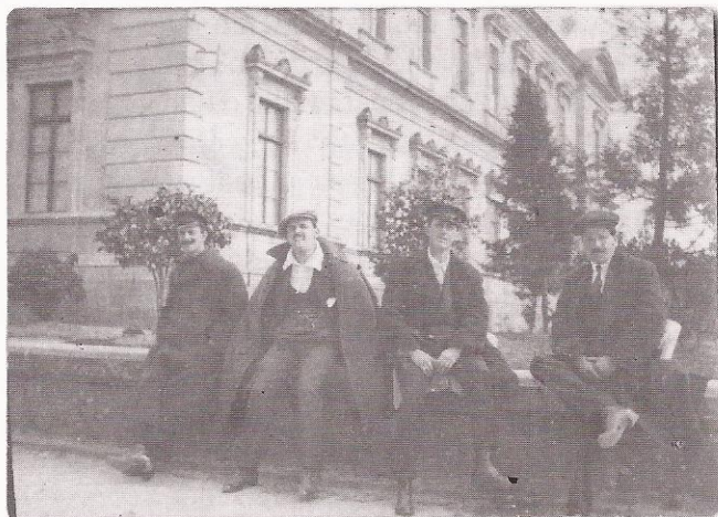
Italianos en Pontevedra