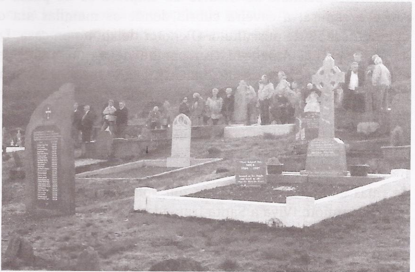
O cemiterio durante a homenaxe // O'Xedas

A Embaixada española e as autoridades irlandesas salientaron nos seus discursos a dimensión humana do acto, a importancia económica das actividades pesqueiras e os fortes vínculos emocionais que existen entre Galicia e Irlanda, especialmente coa illa de Valentia. Actualmente, dos 160 barcos españois que faenan no Gran Sol, 115 son galegos e o resto, da cornixa cantábrica.