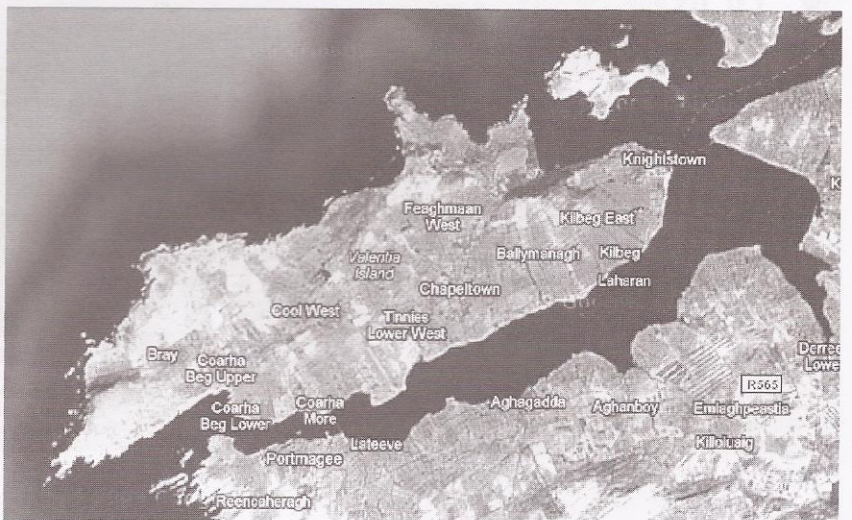
Illa de Valentia // O'Xedas