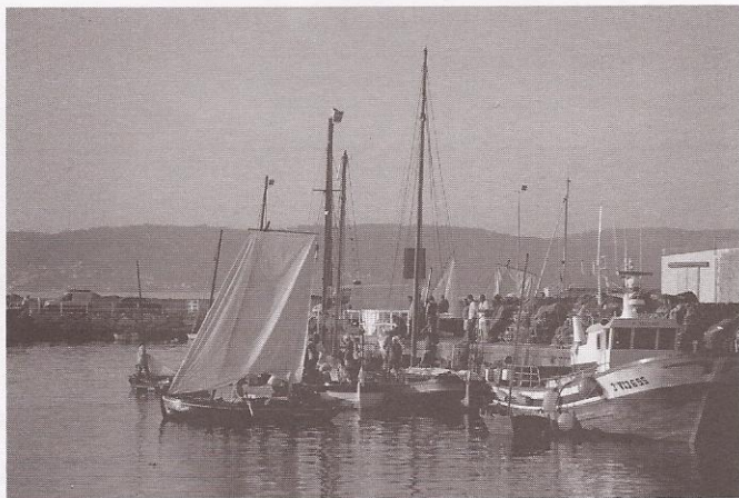
As embarcacións quedan abarloadas ata a saída

chegaron as primeiras embarcacións veciñas á ensenada de Bueu. Pola tarde, trala recepción tiveron ocasión de visualizar un filme no Centro Social do Mar. O sábado xa estaban