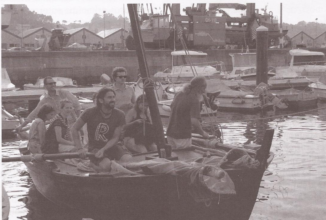
O bote xeiteiro 'Os Galos' chega aos pantaláns logo dunha das travesías durante a Semana Mariñeira

ducia embarcacións visitantes que saírían navegar pola tarde pola costa do municipio. As condicións metereolóxicas eran óptimas para unha navegación sen incidentes. Xa en terra, os navegantes celebraron a cea de despedida na carpa da Festa do Polbo, evento co que xa é habitual coincidir. Amáis das actividades para os participantes do encontro, este ano quíxose involucrar tamén á veciñanza. Conseguiuse grazas á proxección dun documental e de material gráfico da asociación buenense contra a fachada da praza de abastos.