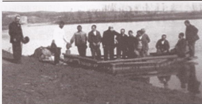
Bendición dunha barca de río. //Xerardo Dasairas

tocase ferro inmediatamente, a ser posible co rizón na proa. Cando era imprescindible a alusión aos curas, esta facíase baixo a forma de "Xa me entendes". Ningún armador ou patrón permitía que un cura subise a bordo nin para ir de paseo, pois a súa presenza era considerada moi nefasta pola tripulación. Polo mesmo