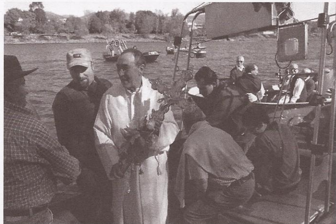
Bendición do Lanzo da Cruz // Xerardo Dasairas

embarcación; a tripulación formaba sobre cuberta e o cura dicía as preces de ritual e facía asperxementos con auga bendita, rogándolle ao Altísimo que protexese aquela xente que loitaba polo panem nostrum quotidianum... Así, ía percorrendo todas as embarcacións e tan arraigado estaba o costume de bendicilas que ninguén se atrevería a saír ao mar sen que antes a Igrexa santificase as artes.