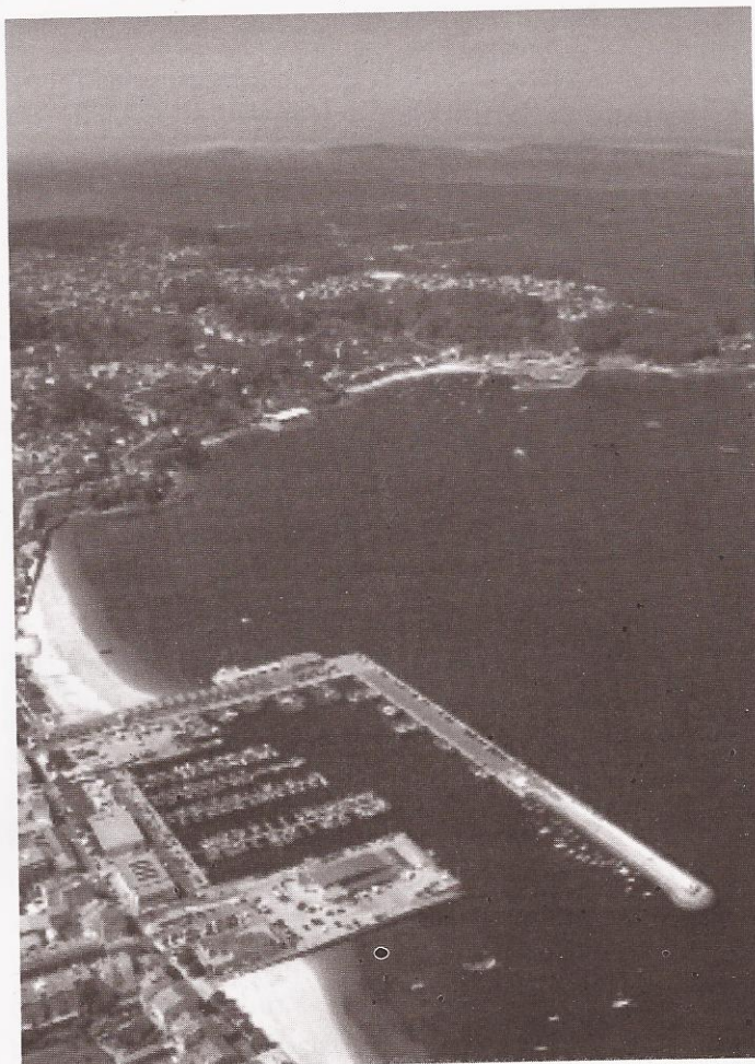
[Vista aérea do porto de Bueu]

O obxectivo principal é a posta en marcha dunha iniciativa cultural orientada ao turismo mariñeiro no que os pescadores sexan os principais actores mediante a súa participación como divulgadores nas rutas creadas no proxecto en dúas modalidades: guiadas e autoguiadas.