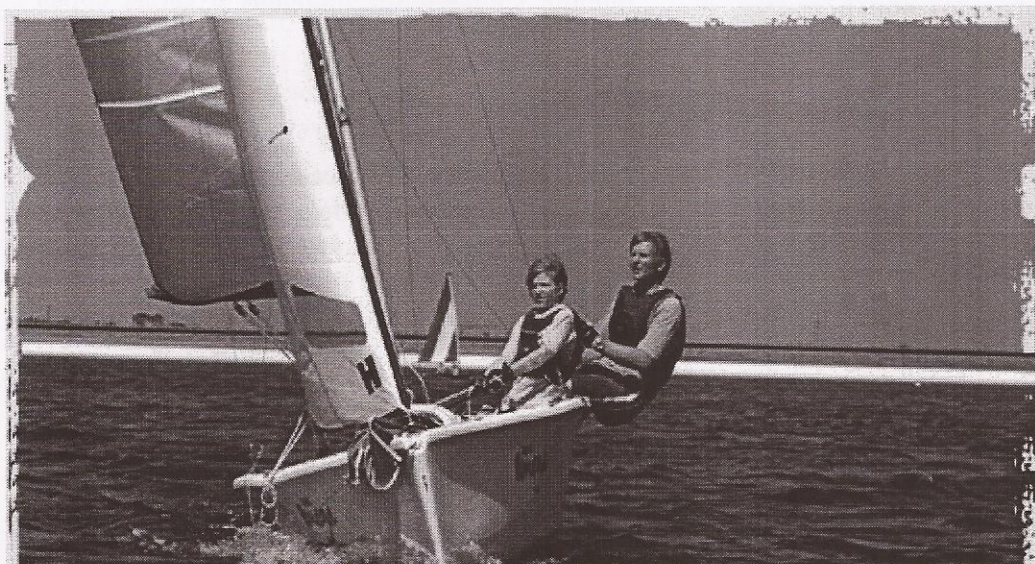
Os omega teñen como principal atractivo a velocidade

profesional e máis esixente fisicamente, ademais é olímpico, como sucede tamén co láser.