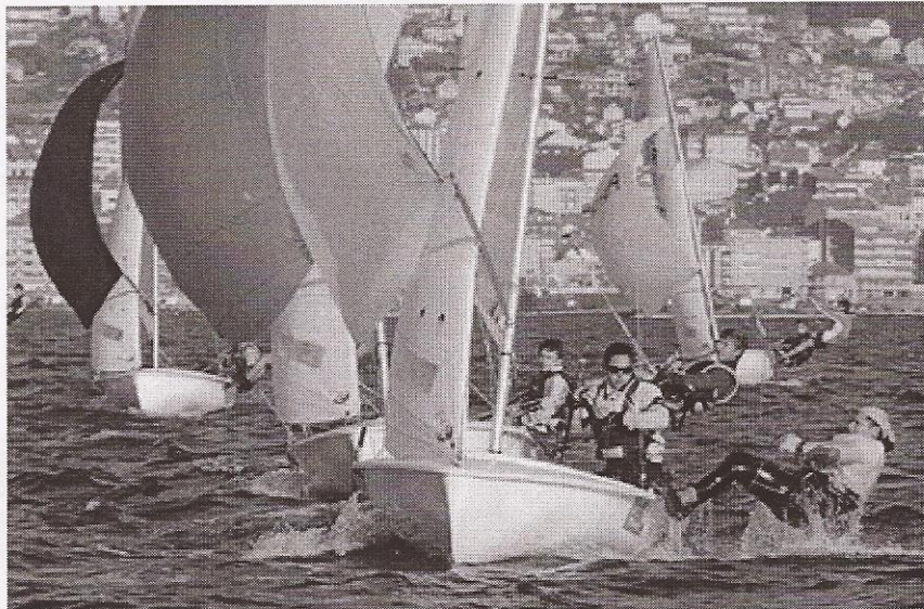
No 420 o proeiro cólgase do trapecio mentres leva o spinaker

Todos saíron das embarcacións da vela lixeira, o que evidencia que é dela de onde saíran os regatistas do futuro, aqueles que tripularán os cruceiros nas grandes regatas do Mediterráneo ou das próximas Volvo Ocean Race, ou os que nos representan nas olimpíadas. Unha modalidade nutre a outra. Por iso é tan importante para este deporte que a vela lixeira goce de boa saúde, xa que depende dela o futuro deste deporte en Galicia.