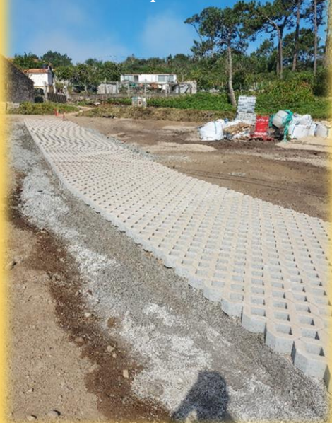
Camiño de servizo para vehículos