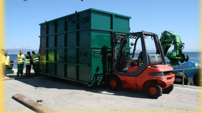
Chegada da última depuradora no 2012 a Ons.

Despois da explicación ben detallada, pregunta: <Como se están a desenvolver as obras da depuradora da Illa de Ons, en base a encomenda á empresa pública Tragsa, á que se lle adxudicou a mellora do ciclo integral da auga do Parque Nacional das Illas Atlánticas?>