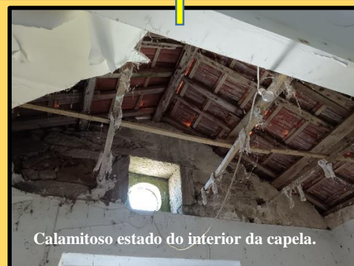
Calamitoso estado do interior da capela.

Cunha perfecta documentación anterior, pasa a efectuar a pregunta:<“Como se están a desenvolver as obras licitadas coa denominación Acondicionamento da Illa de Ons....”>