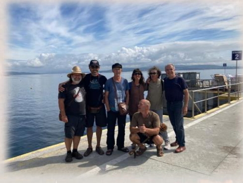
A soidade do último fareiro polo peirao de Ons cara a un novo destino, e a despedida dos seus amigos