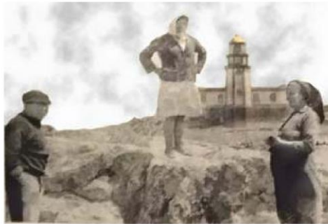
Veciños de Ons fronte ao faro en 1967