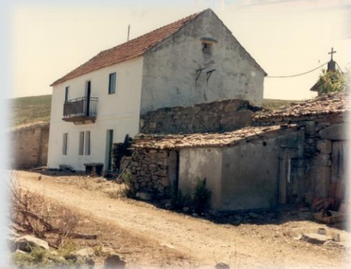
Casa agrícola de Canexol, despois convertida en Casa de Mestres e Reitoral. Nela viviu e impartiu clase M a Dolores Sabarís Abal.