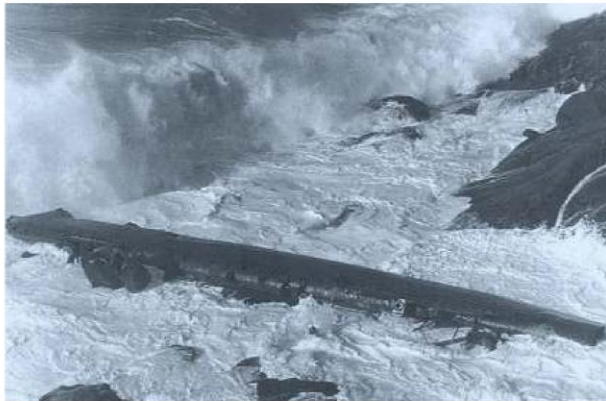
O submarino "General Mola" que encallou ao carón da Illa Freitosa, ao oeste de Ons.