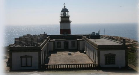
Faro da Illa de Sálvora

As nosas ideas non resultaron útiles para a administración, sería seguir co seu mantemento, que debe ser custoso, e a solución que se lles buscou foi a hostaleira ou de restauración, repetimos, non é mala idea aínda que podería ser mellorable.