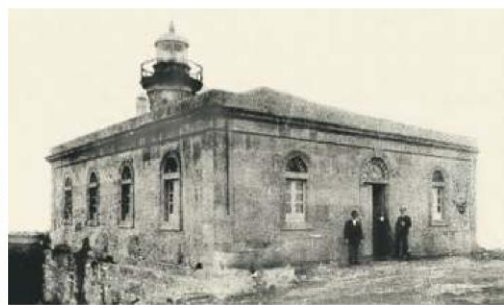
O antigo Faro de Ons en 1867