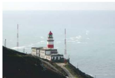
Faro de cabo Silleiro. Baiona. Un dos últimos en incorporarse a Faro hotel

que a figura do Fareiro xa non é necesaria e polo tanto esas instalacións, agás a lanterna e algún espazo necesario para a maquinaria, convértense para a administración nuns edificios que polas súas características e situación, van a representar un elevado custo económico de mantemento que non están dispostos a asumir.