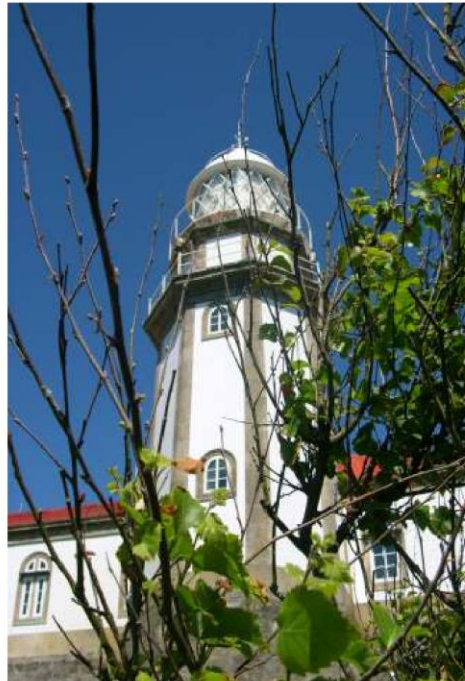
A torre do Faro ofrece vistas exclusivas sobre a Illa, a Ría e o mar

Xa por último, non queremos esquecermos da figura dun Técnico-Dinamizador que sexa quen de poñer todo a andar e que saiba coordinarse perfectamente con todas as persoas e organismos que farían posible que tanto o Faro como o Centro de Visitantes sexan uns Espazos Activos que esperten fascinación por esta Illa, polas demais do Parque e pola cultural en xeral.