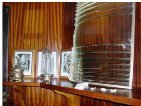
Algunhas das pezas que se exhibían no museo do Faro

Museo dos Faros: Ata o ano 2023, nunha das salas do Faro de Ons, había expostos un bo número de aparellos relacionados co propio Faro da Illa e doutros das proximidades.