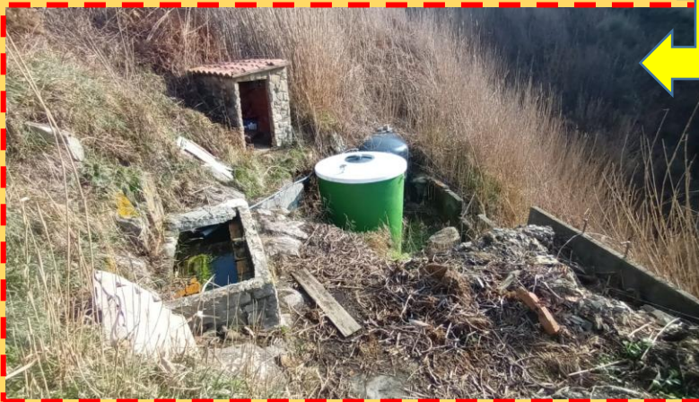
Fotos expostas no seu momento e que demostran o estado no que se atopaba a fonte de Caniveleñas no momento de comezar o seu arranxo no 2023.