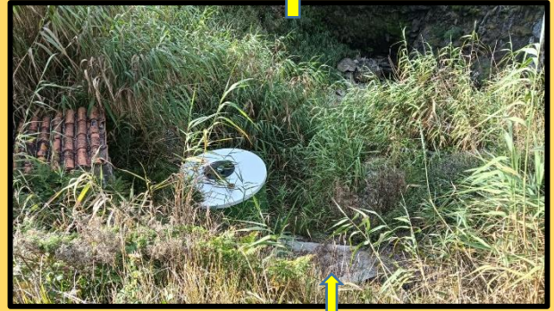
Fotos enviadas polo lector, onde se ve a zona acoutada e o espazo da fonte un pouco asilvestrada.