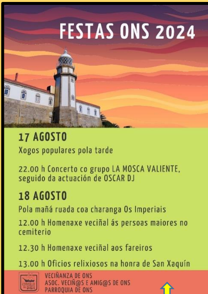
Cartel anunciador da Festa 2024