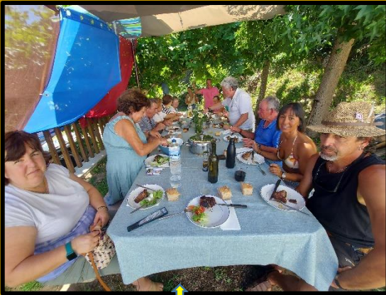
Xullo de papadelas na Illa de Ons. Páx. 1

Para comunicar con Onstopus: tinopardellas1957@gmail.com / celestinopardellas@gmail.com