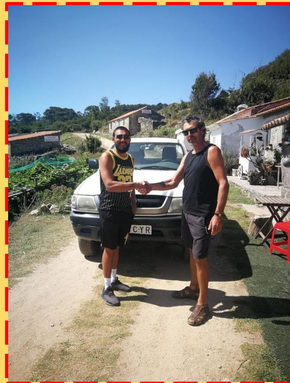
felicitando ao condutor do Campamento polo seu respectuoso proceder durante esta tempada.

Esperemos que este novo curso a nova Directora Xeral de Patrimonio Natural, cumpra as promesas que a anterior non cumpriu, e todo o prometido, entre o que están o arranxo definitivo dos camiños de Ons, sexan unha realidade.