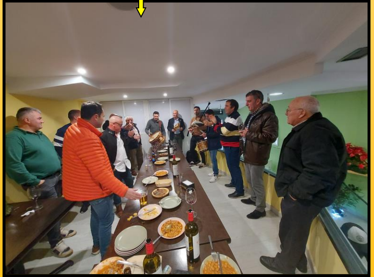
E xa, na Papadela Oficial, no restaurante Pescador