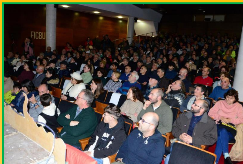
Abarrotado o Centro Social del Mar de Bueu na presentación do documental.

O Patrimonio Etnográfico de Ons está case que perdido pola falla de investigación e a desidia das administracións, tanto autonómicas como municipais. Anos levamos pedindo contactos coa universidade, estudosos, investigadores,..., para que impulsaran proxectos sobre esta materia, pero sempre se fixeron oídos xordos, e esta importantísima Cultura Popular auniense transmitida de pais a fillos durante máis de 150 anos, coa emigración forzosa cara ao continente e a entrada noutra cultura diferente á que viviran, fixo que a pasos de xigante se fose esquecendo ata case perderse. Por iso este pequeno documental, realizado no momento preciso, é un respiro e unha iniciativa interesante para ver se ten continuación con outras características deste significativo Patrimonio inmaterial e material desta Comunidade. En Ons, neste intres, só queda unha dorna e un veciño-mariñeiro que con 81 anos aínda a fai activa. Cesáreo naceu nesta embarcación na que foi aprendendo o oficio. É o único que podía explicarnos, en persoa e de xeito activo a, xa histórica arte da pesca do polbo tradicional, que provocou un significativo cambio económico nesta Comunidade. Fago unha petición para que as administracións impulsen investigación sobre o Patrimonio Inmaterial e Material de Ons. De non facelo agora, en nada, quedará esquecido para sempre.