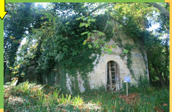
Arriba: Laxe do Crego (Ons). Abaixo: Capela de Cortegada.