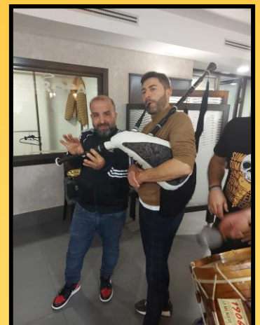
Non faltou a música e o bo humor