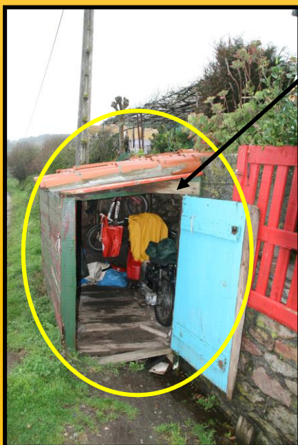
No recadro o Galpón Susuki

Parece que pensa deixar o mundo da competición, pero iso non quere dicir que deixe a súa paixón polo motociclismo e as motos, polo que habilitou un mellor espazo para resgardar os seus tesouros de dúas rodas que tantos triunfos lle deron.