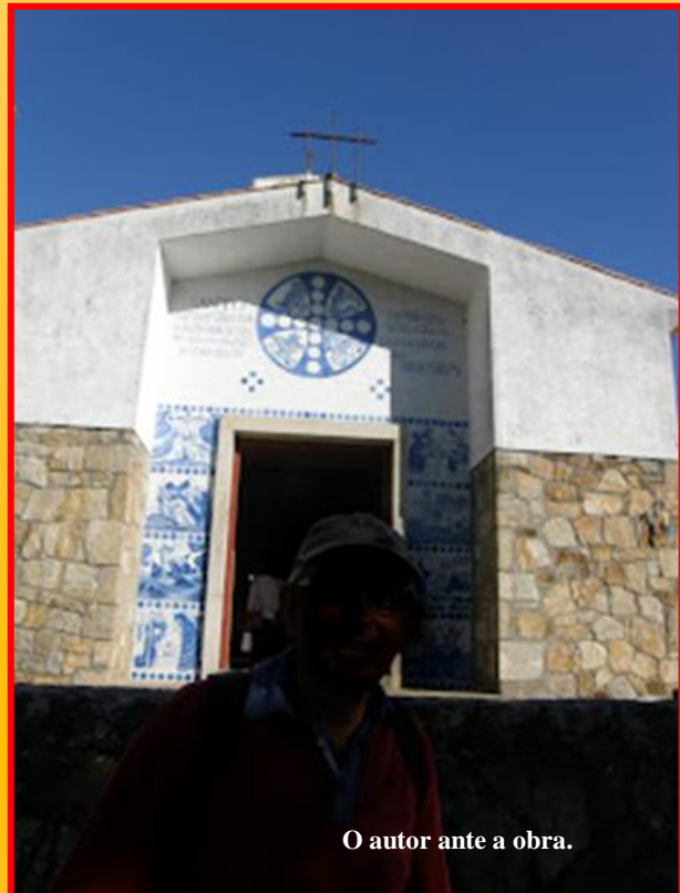
O autor ante a obra.