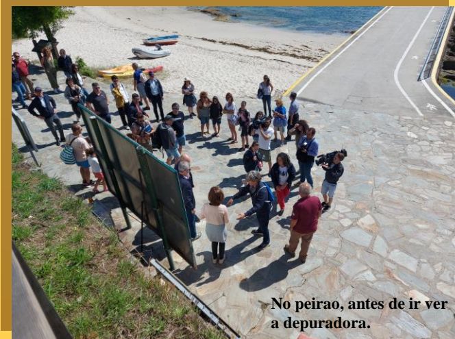
No peirao, antes de ir ver a depuradora.

Ata o de agora a única promesa que cumpriron, pois a partires de outubro comezaron de novo a escavar no Castro. Estamos a espera de que dean novas dos resultados sobre estas e anteriores escavacións.