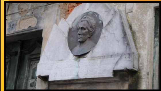
Diferentes imaxes da casa de Matilde Bares. Faro de Vigo