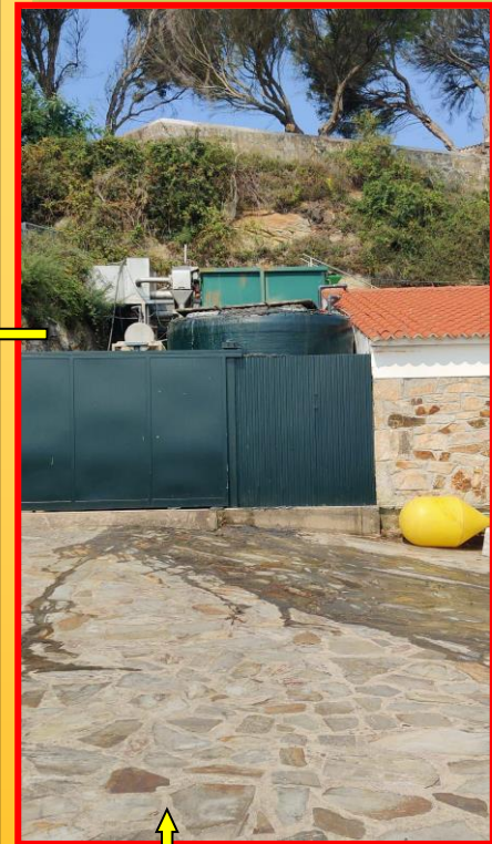
Foto arriba dereita: Vertido da depuradora en agosto de 2021. Faro de Vigo. Foto esquerda: Escavacións no Castro dos Mouros en Canexol.

O segundo é o tema da ARQUEOLOXÍA . Segundo o Director do Parque, as prospeccións arqueolóxicas retornarían este setembro, por mor dos excelentes e importantísimos vestixios que agocha este xacemento para a historia de Ons. Tamén faláron de musealizar o castro, sinalizalo, traer para o Centro de Visitantes o material atopado,..., e, algo que considero moi interesante, aínda que non para setembro senón para o próximo verán, a volta a Ons dun Campo de Traballo, ou de Voluntariado, Arqueolóxico.