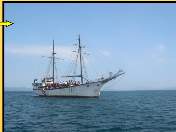
Foto: O Nieves fondeado fronte a Illa de Ons. O día da presentación, mes de xuño de 2011