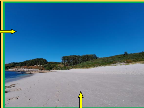
Melide queda sen sombra.

É necesario un Técnico Dinamizador , senón o Parque non funciona.