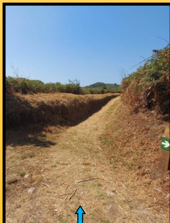
Camiño que, dende o sendeiro anterior (esquerda), vai cara á Enseada de Caniveleñas