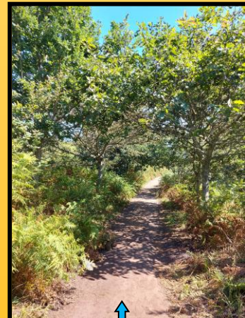
Camiño que dende Curro e a carón do mar, chega á engaiolante praia de Melide