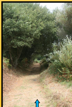
Sendeiro no barrio de Caño camiño do cemiterio e Canexol.

Pasear pola Illa podemos clasificalo coma unha <sedución natural>. Os pequenos camiños, sendeiros e corredeiras están nun magnífico estado para deambular en contacto coa natureza.