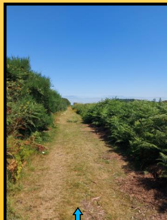
Corredeira que dende o Campamento da Xunta vai á Enseada de Caniveleñas