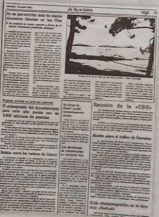
Página de la Voz de Galicia publicada el 22 de abril de 1981

Desde los años serenos, las Cíes fueron un espacio de tierra al margen de cualquier control. Los visitantes acampaban en cualquier sitio y algunos de ellos eran personas perseguidas por la Justicia, lo que hacía más complicada la convivencia en este paraíso hoy en día tan exaltado. La Voz de Galicia denunciaba entonces que «algunos habituales campistas han llegado casi a privatizar zonas de uso público con rústicas construcciones para su servicio particular, con la pretensión de que permanezcan todo el año y disponer de un sitio