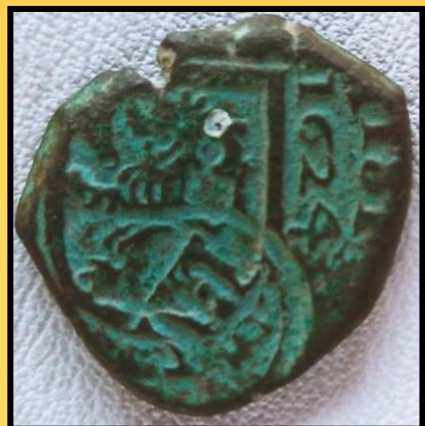
Marabedí atopado en Cortegada.