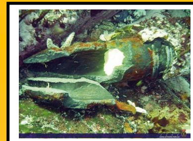
O patrulleiro Barsac e munición atopada en Onza do Barsac.