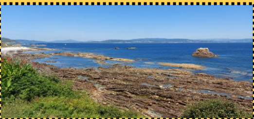
Foto arriba esquerda: Rochas dende o Castelo da Rueda ata o peirao.