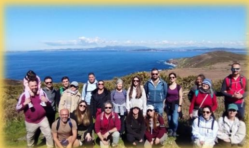
Ruta en Ons organizada polo Parque: “A illa e o mar”. Mes de marzo 2025.

Coido que habería, como levamos reivindicando dende hai xa anos, que estas actividades, e moitas outras, se programen a principios de ano, polo que, varias semanas antes de calquera período vacacional, as persoas-turistas que queren visitar un Parque Nacional, teñan xa un programa preparado con antelación, para poderse anotar con tempo e, que a administración consiga, por fin, que os turistas-visitantes que veñen en época vacacional, vaian a un Parque Nacional que posúe unhas actividades programadas para coñecerlo en profundidade. Penso que este Parque ten persoal preparado para levar a cabo un programa anual de actividades para etapas de vacacións, se non se fai, é que algo esta fallando.