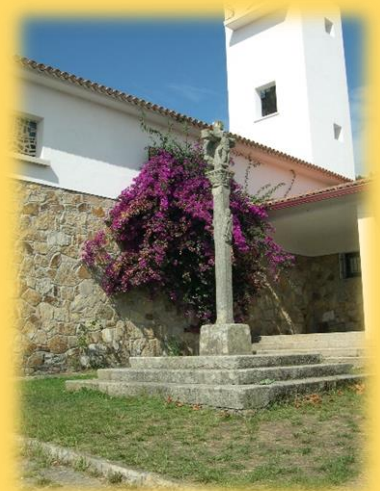
Esquerda: Moeda única da traslatio atopada nas escavacións de Adro Vello (San Vicente-O Grove) no ano 1985 e que se atopa no Museo das Peregrinacións. Dereita: Cruceiro no atrio da igrexa de Curro (Illa de Ons).