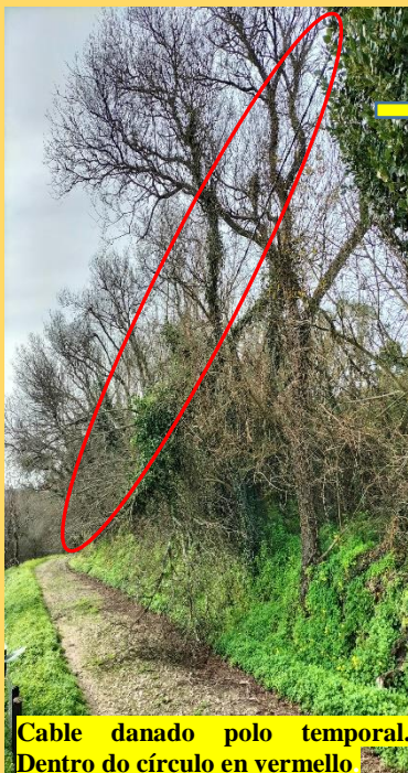
Cable danado polo temporal. Dentro do círculo en vermello