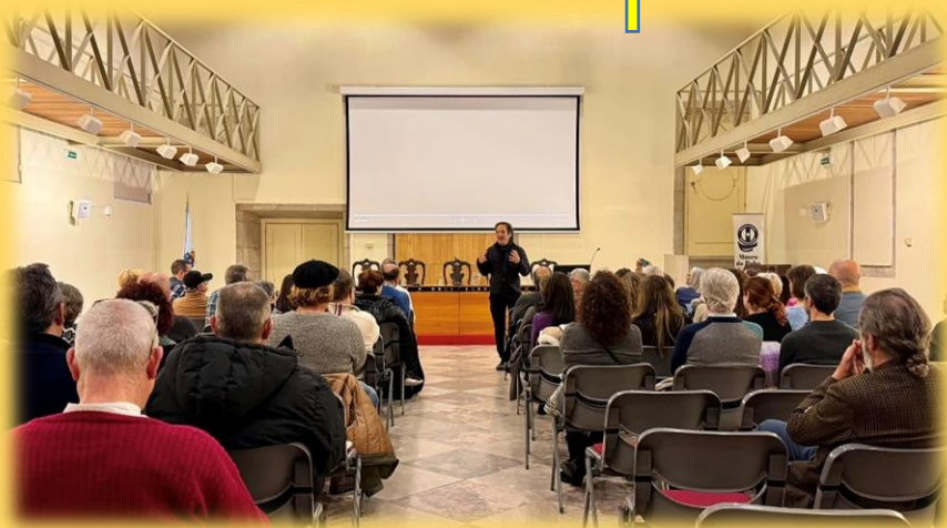
nun momento da presentación do documental.

Non me cansarei de aproveitar calquera ocasión para solicitar aos organismos correspondentes e, en especial, aos que teñen responsabilidades nas illas do Parque, para que apoiem proxectos, para investigar a cultura popular destas illas, pois de non facelo agora, perderase para sempre.