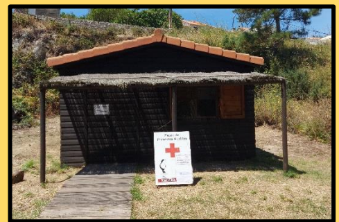
Fotos. Esquerda : Tendas do Campo de Tralaballo. Centro : Tendas do Campamento xuvenil. Dereita : Caseta de Primeiro auxilios no ano 2020.