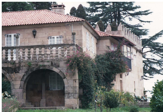
O pazo de Santa Cruz, unha das reliquias medievais que se conservan no termo municipal de Bueu. Construído en 1671 polo licenciado don Fernando de la Rúa y Freire, abade-párroco da vila, pertenceu sucesivamente ós Rúa e os Pimentel.

Ir máis atrás e buscar nas orixes de Bueu é traballo comprometido. Historiadores de principio de século insistiron, baseándose fundamentalmente na toponimia -no carácter grego das primeiras formacións da poboación na península do Morrazo. É unha hipótese sen máis valor da que moi poucos se preocuparon de confirmar ou desmentir. Si está probada en cambio, a presenza romana, a través de numerosas moedas e machadas de bronce achadas en Ons. Practicamente aillado durante varios séculos, o municipio foi invadido -tantas praias abertas ó mar- repetidas