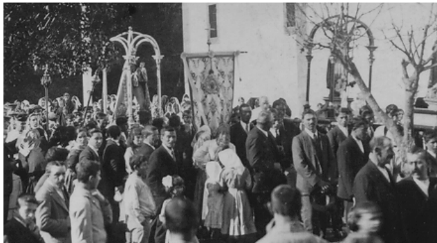
Procesión de San Martiño - Bueu

Tras esta doazón, un período de obscuridade histórica cíñese sobre o noso pobo, despezándose no s. XIII co recoñecemento da existencia da ferigresía de S. Martiño de Bueu. Acontecía o ano 1246, cumprindo agora exactamente setecentos cincuenta anos. A partir deste dato as múltiples testemuñas repítese unha e outra vez no mesmo sentido, confirmando a documentación anterior.