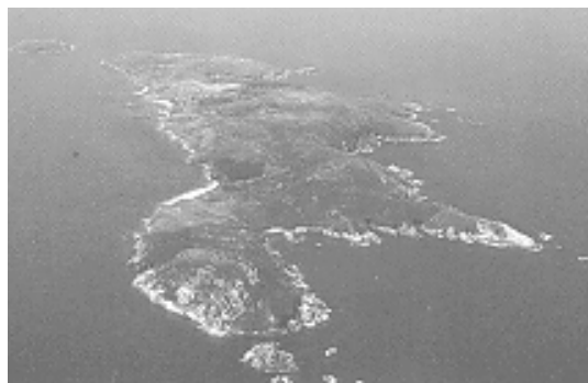
Illa de Ons

¡Que fermoso é deslizarse suavemente sobre o raso azulina da ría, nunha mañá de sol, de aire morno, que roza as nosas fronteiras como o consolo dunhas mans agarimosas. As velas extendidas do balandro que nos leva, parecen as ás que milagreiramente naceron nos nosos lombos ó mergullarnos no ensoño do horizonte atractivo. Coma nos contos de fadas voamos sen dirección fixa, ó parecer, sen máis fin que o goce de sentirnos levar. Rapidamente, suavemente, esbarando sobre as tranquilas augas.