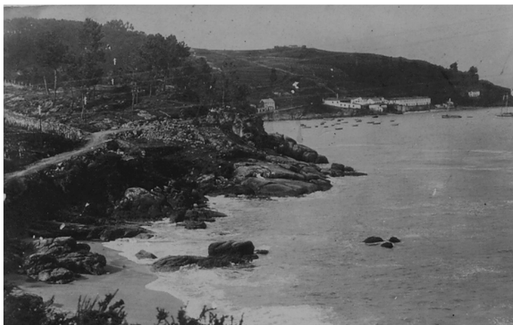
Camiño da praia de Beluso

É don Homobono O home de máis sorte que hoxe en día se coñece por estes lares. Cada un dos seus pasos, márcalle un camiño de satisfacción e benandanza. Todo lle sorrí e leva da vida felicidade completa.